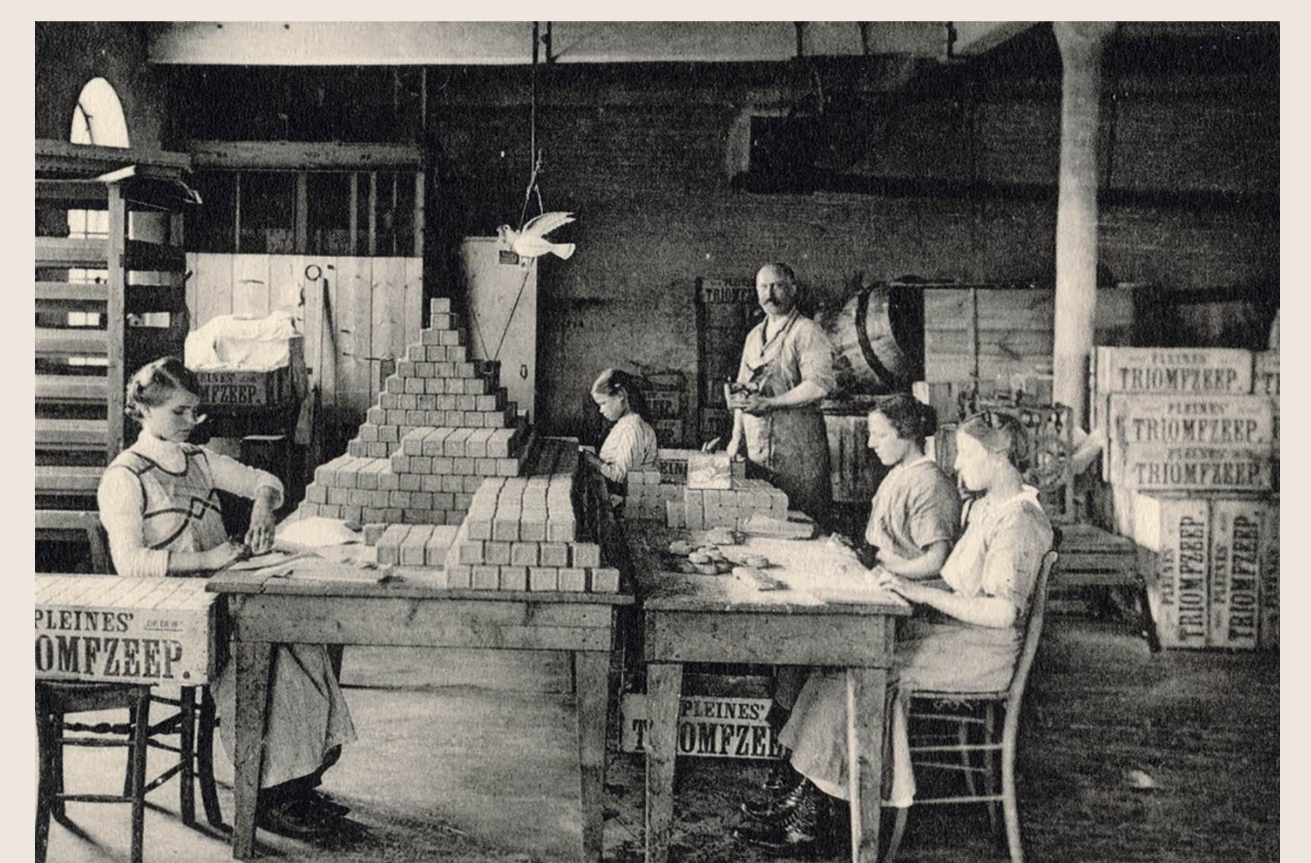
Inpakafdeling van Zeepfabriek De Duif in 1914