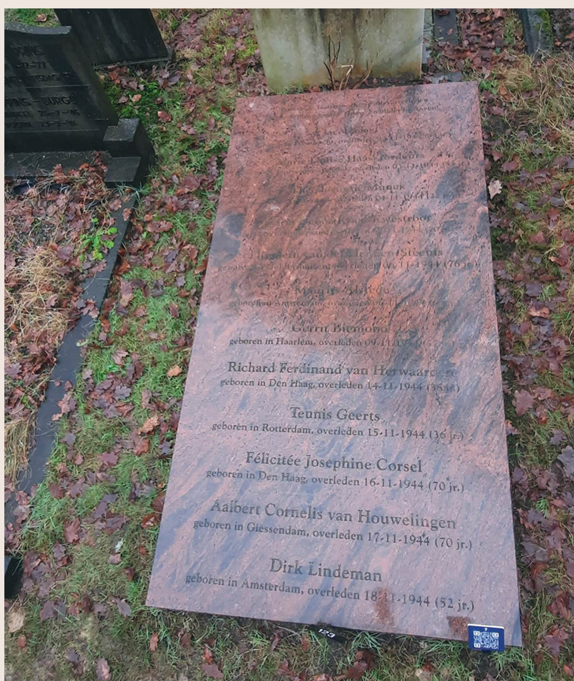
Graf voor twaalf patiënten van de Willem Arntsz Hoeve in vak C