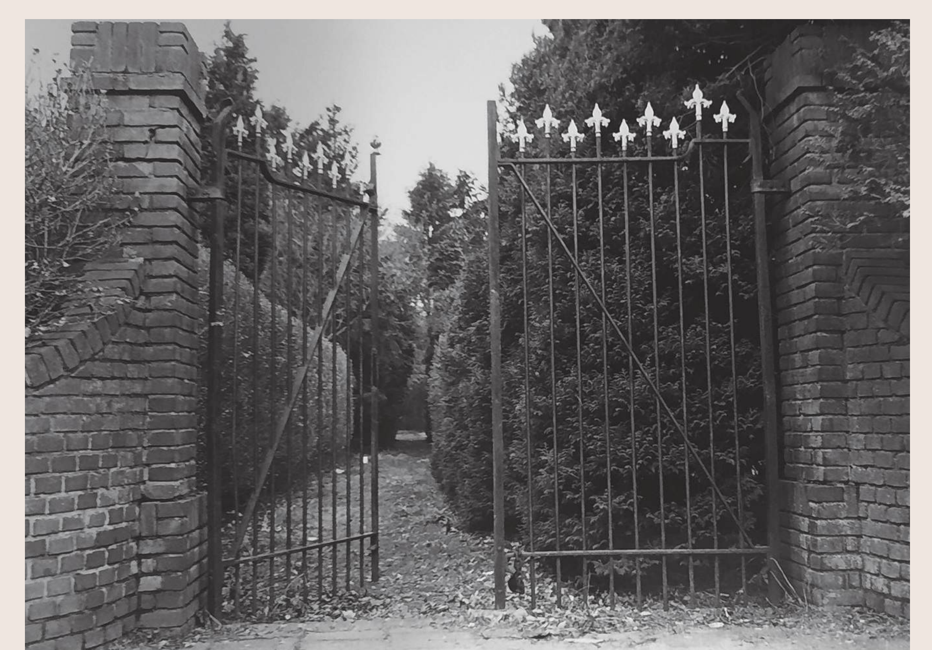
De ingang van Het Stille Hofje in ca. 1985

Dit informatiebord maakt deel uit van een serie borden bij cultuurhistorische bezienswaardigheden in Zeist, Austerlitz, Bosch en Duin, Huis ter Heide en Den Dolder. De informatie op deze borden is namens de erfgoedpartners samengesteld door het Zeister Historisch Genootschap, Stichting het Gilde, Historische Vereniging Den Dolder en de gemeente Zeist.