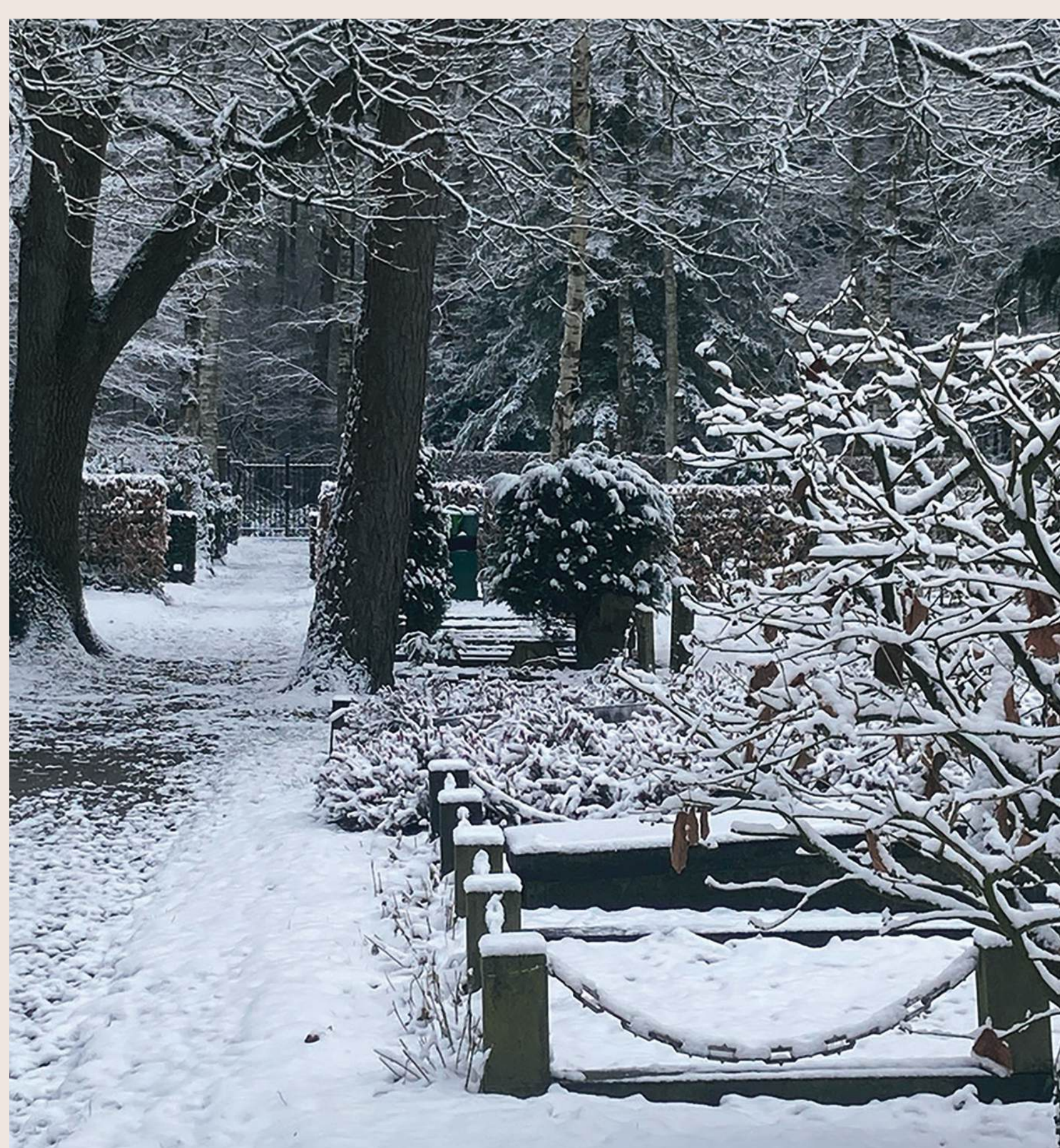
Het Stille Hofje in de sneeuw in 2026