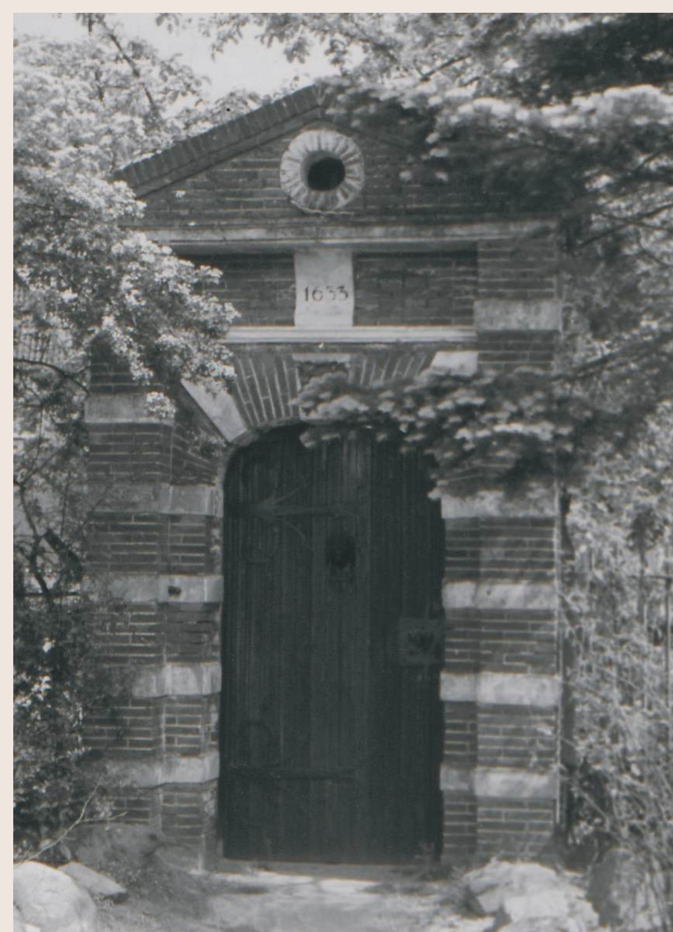
Het poortje van Kersbergen langs de Utrechtseweg in 1961