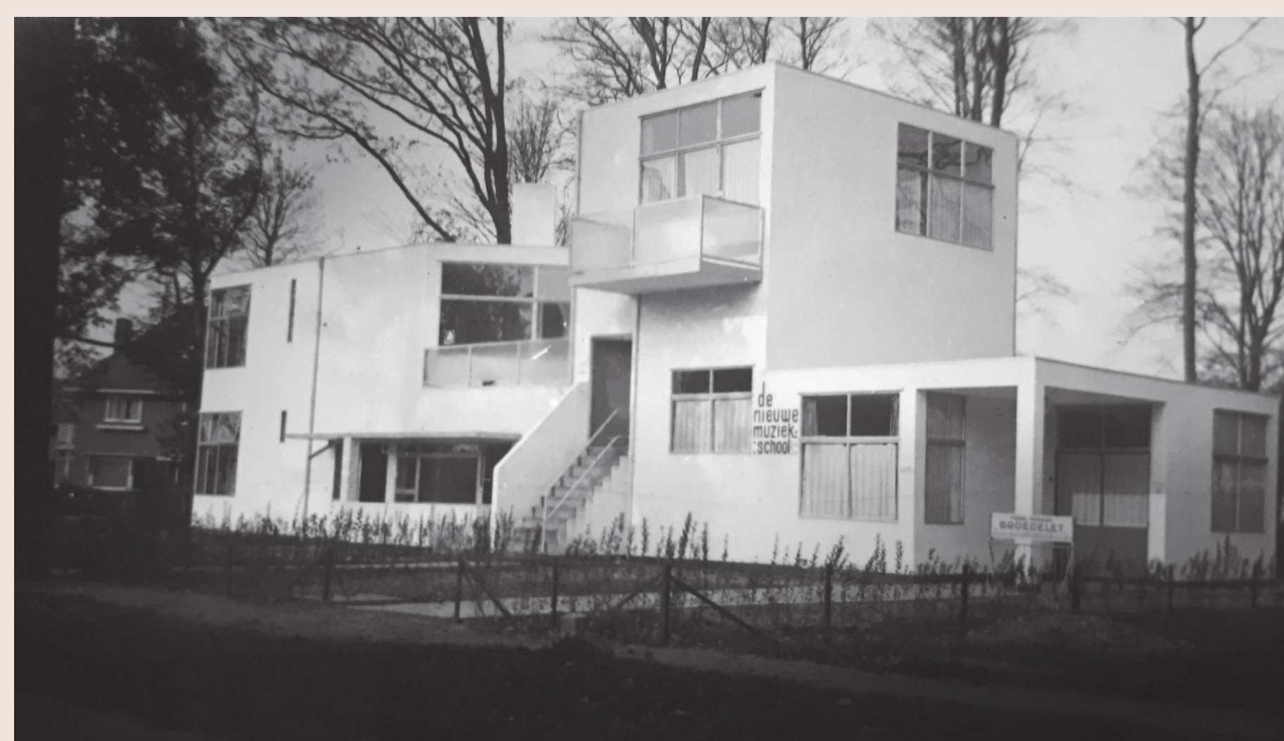
De muziekschool van Gerrit Rietveld, kort na de bouw

Villapark Kersbergen is vernoemd naar kasteel Kersbergen dat hier eeuwenlang heeft gestaan. Het is zo'n 400 jaar familiebezit van het invloedrijke geslacht Van Renesse, waar de Van Renesselaan nog naar verwijst.