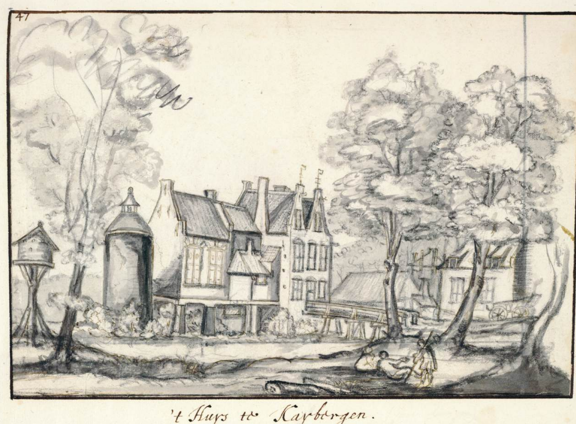
't Huis te Kersbergen.