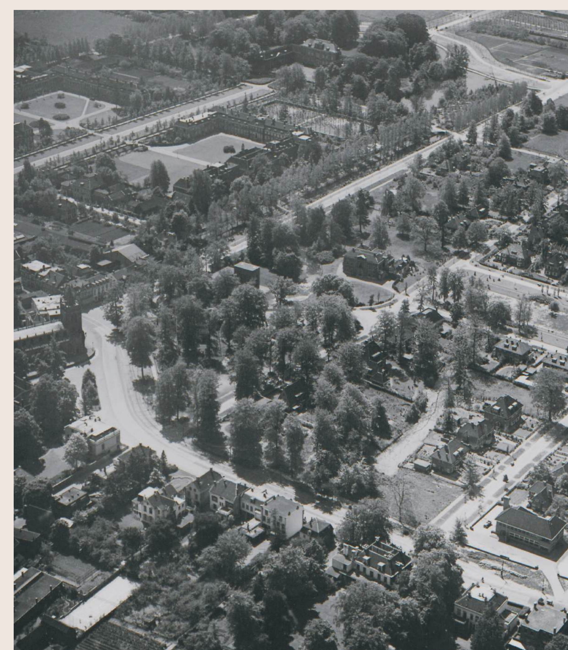
Luchtfoto van de wijk Kersbergen in aanbouw in 1933. Het stratenpatroon en de eerste huizen zijn al zichtbaar, maar ook het landhuis is links van de vijver nog aanwezig. Bovenaan de foto is Slot Zeist te zien en links in het midden staat de toren van de Oude Kerk