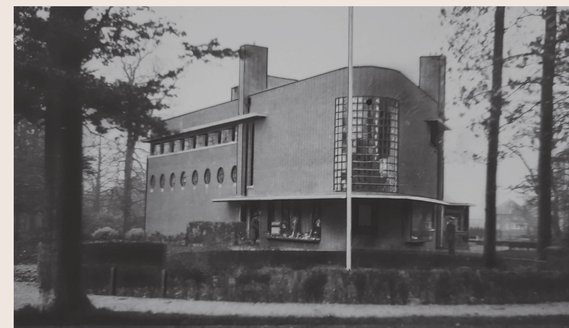
Het schakelstation van de PUEM in de jaren 30 van de 20e eeuw