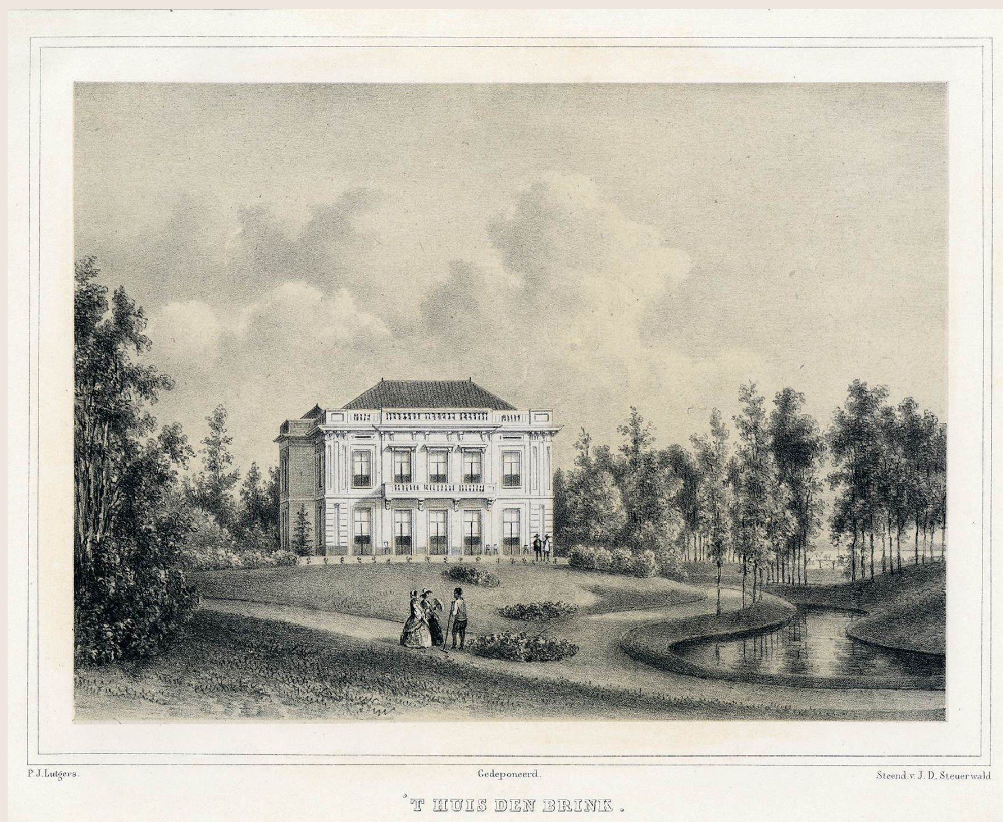
Gezicht op De Brink door P.J. Lutgers in 1869