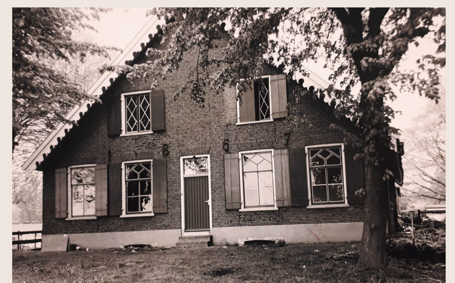
De zuidgevel van boerderij De Brink rond 1960. Boven de begane grond geven muurankers het bouwjaar aan