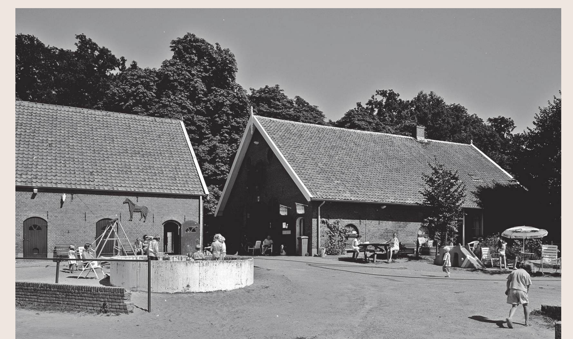
Vermaak op kinderboerderij De Brink in 1995