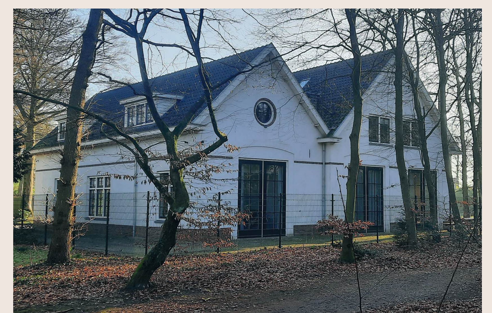
Het voormalige koetshuis van De Brink