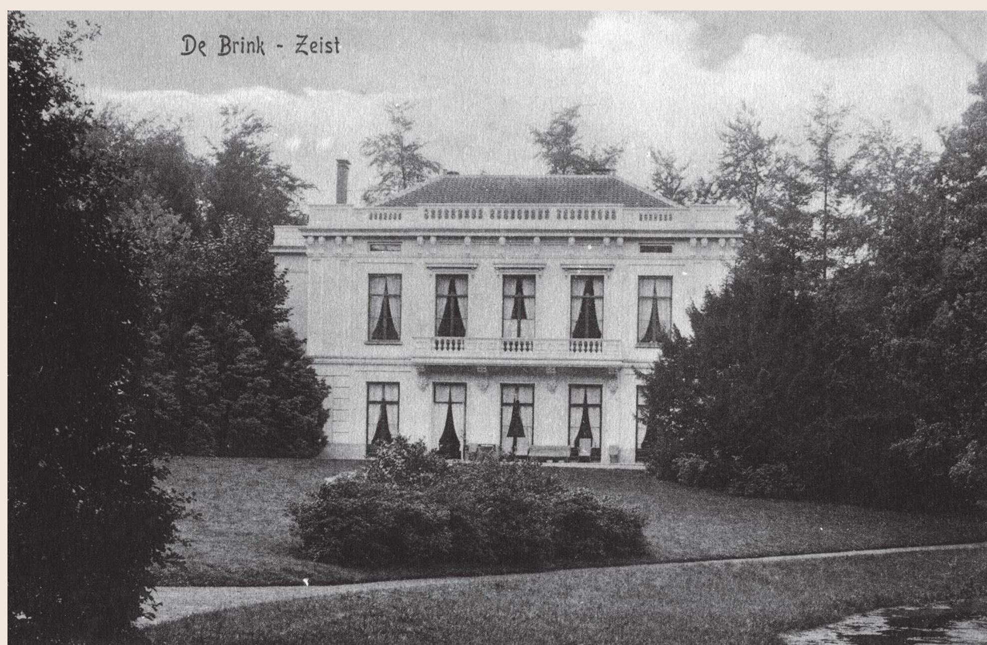
De Brink met omliggend park in ca. 1905

Zeist is ontstaan uit een aantal brinknederzettingen op de grens van de droge zandgronden van de Utrechtse Heuvelrug en de natte kleigronden van het Kromme Rijngebied. De best bewaarde brink met de oorspronkelijke driehoekige vorm bevindt zich direct achter dit informatiebord.