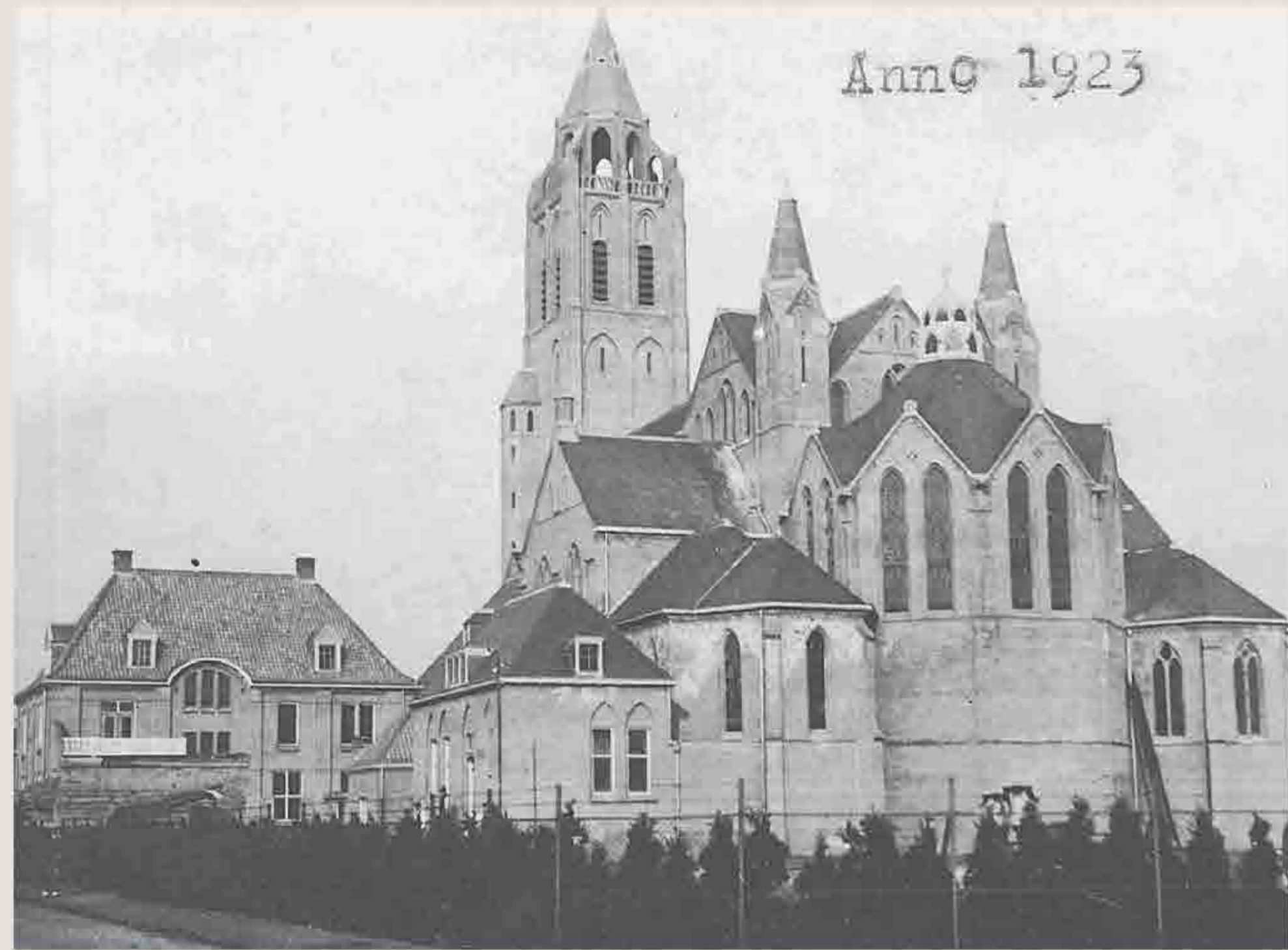
De kerk anno 1923