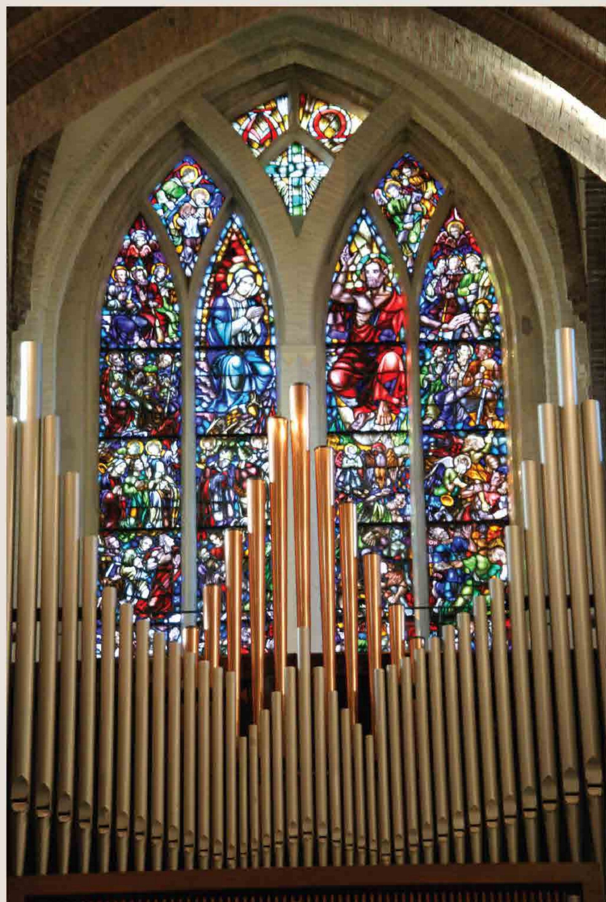
Een foto van het glas-in-loodraam met de voorstelling van het Laatste Oordeel boven de hoofdingang.

Begin 1900 was de St. Josephkerk aan de Utrechtseweg te klein geworden voor de 3000 katholieken die Zeist toen telde en besloot het kerkbestuur een nieuwe kerk te bouwen. Architect Wolter te Riele, een leerling van P.J.H. Cuypers, ontwierp een sobere basilicale kruiskerk in late neogotische stijl met een breed middenschip en twee smalle zijbeuken.