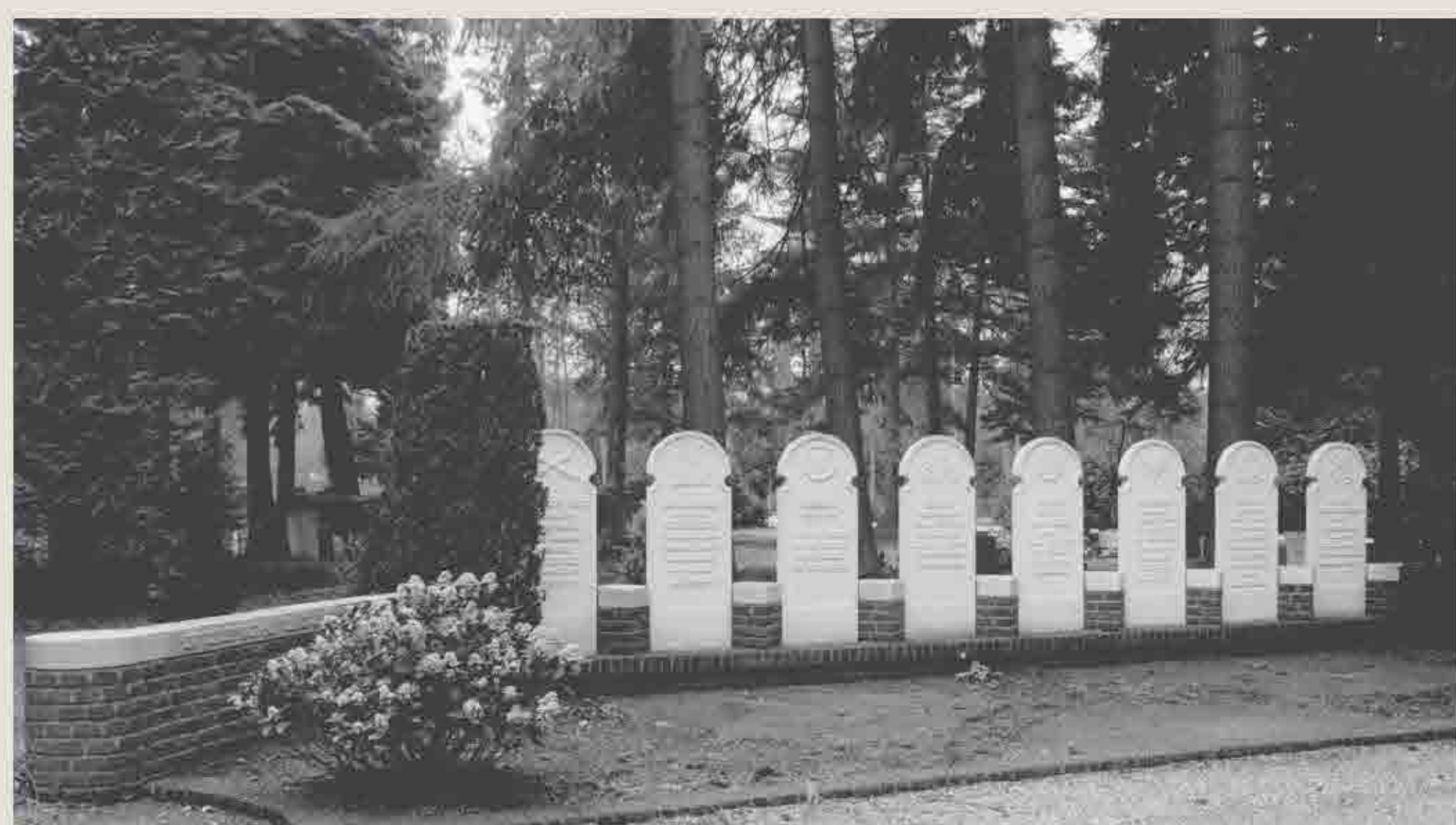
Acht van de doorgesloten mannen liggen begraven op de algemene begraafplaats.

Op donderdag 5 april 1945 werden hier, omstreeks 6.30 uur, tien mannen door een Duits executiepeloton doodgeschoten, waarschijnlijk als represaillemaatregel voor een aanslag op Duitse militairen op 27 of 28 maart 1945. De mannen waren uit het Huis van Bewaring in Utrecht gehaald, waar zij gevangen zaten, vier van hen wegens illegale activiteiten, zoals het helpen van (joodse) onderduikers en deelnemen aan sabotageploegen. Na de executie zijn de mannen begraven op de Nieuwe Algemene Begraafplaats aan de Woudenbergseweg in Zeist.