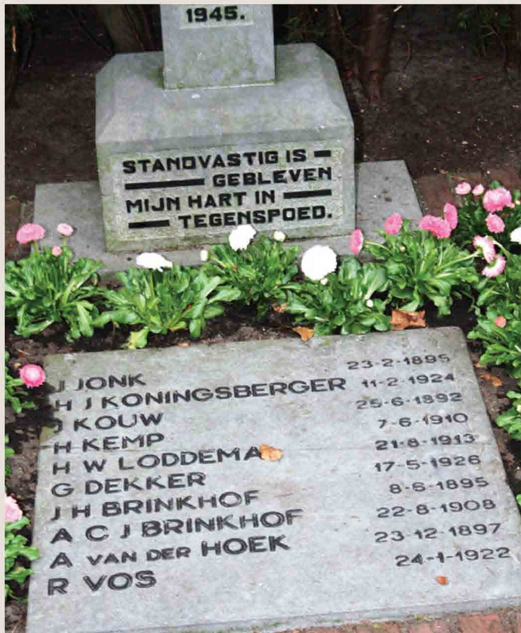
Het monument met de namen van de tien mannen, die door de Duitsers zijn doodgeschoten op 5 april 1945.