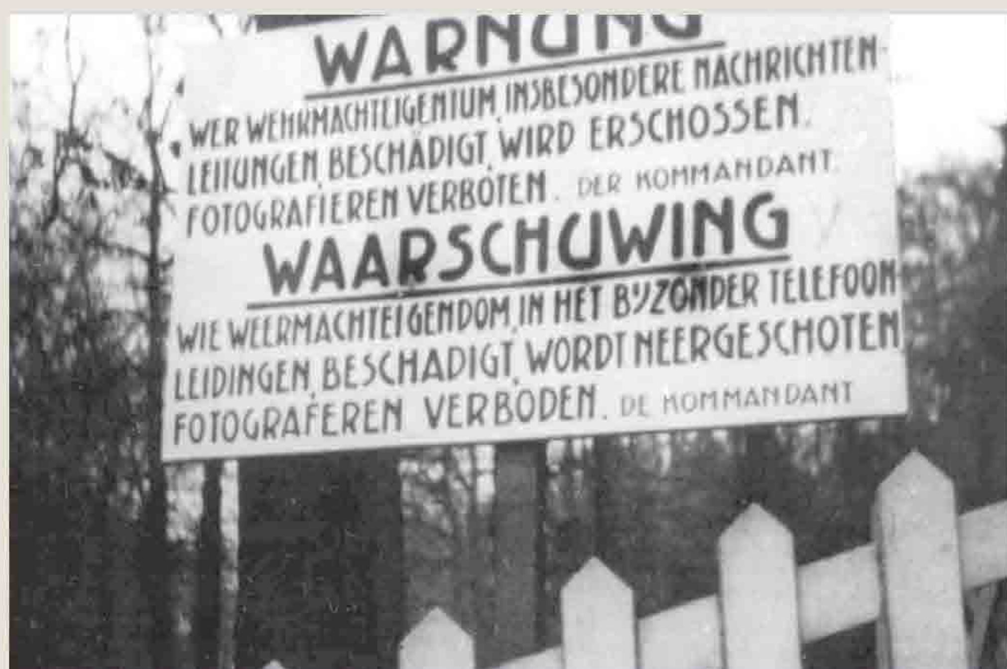
Verbodsbord van de Duitse bezetter.