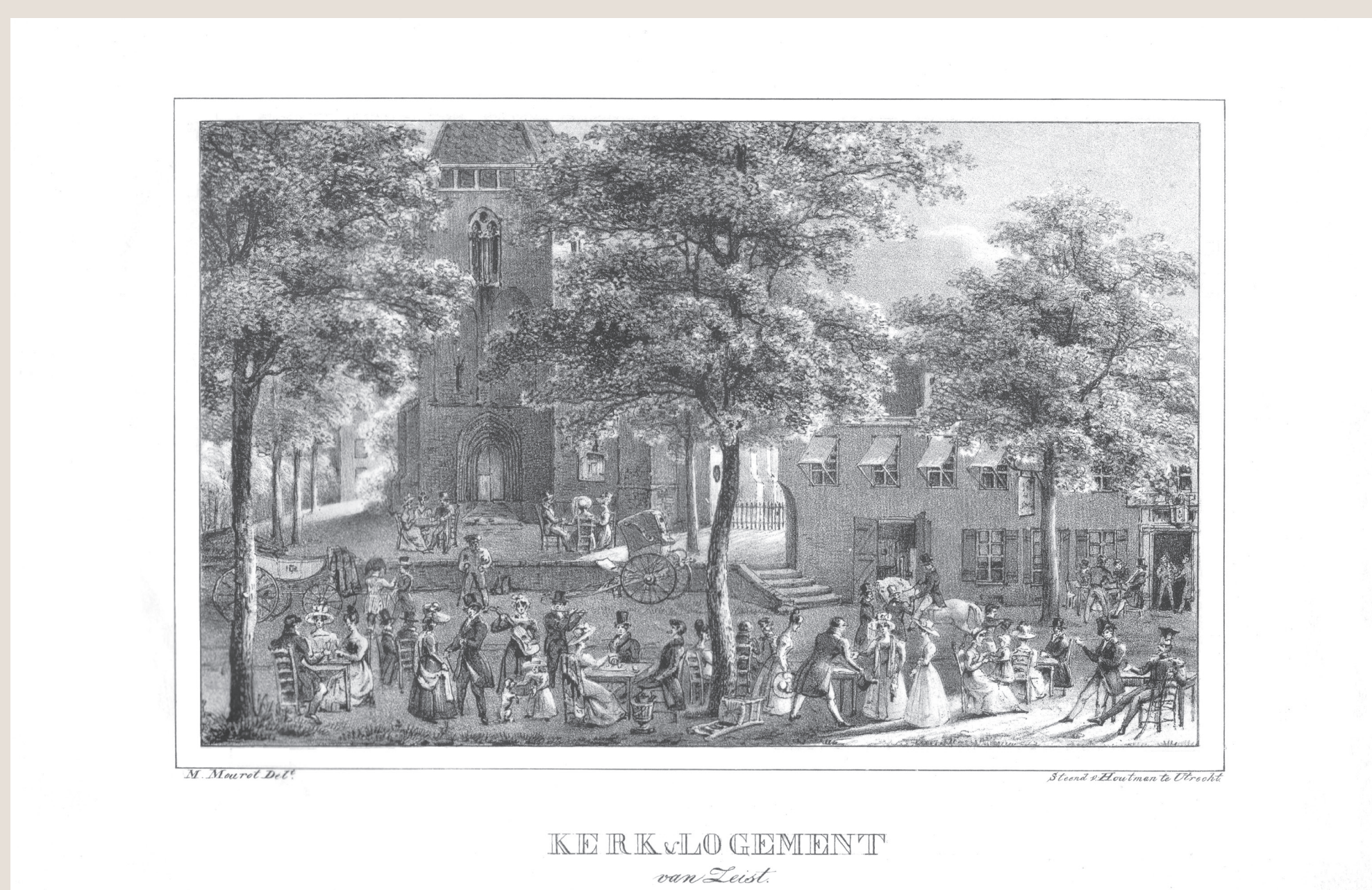
De Oude Kerk en de omliggende herbergen door Jean Mourot, ca. 1830