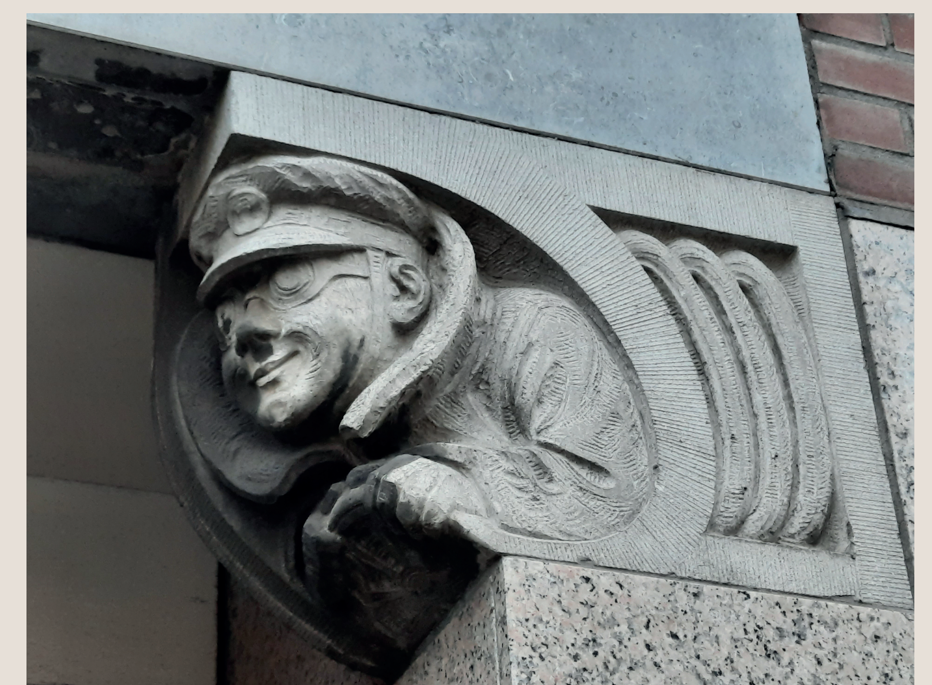
Chauffeur van Broedelet