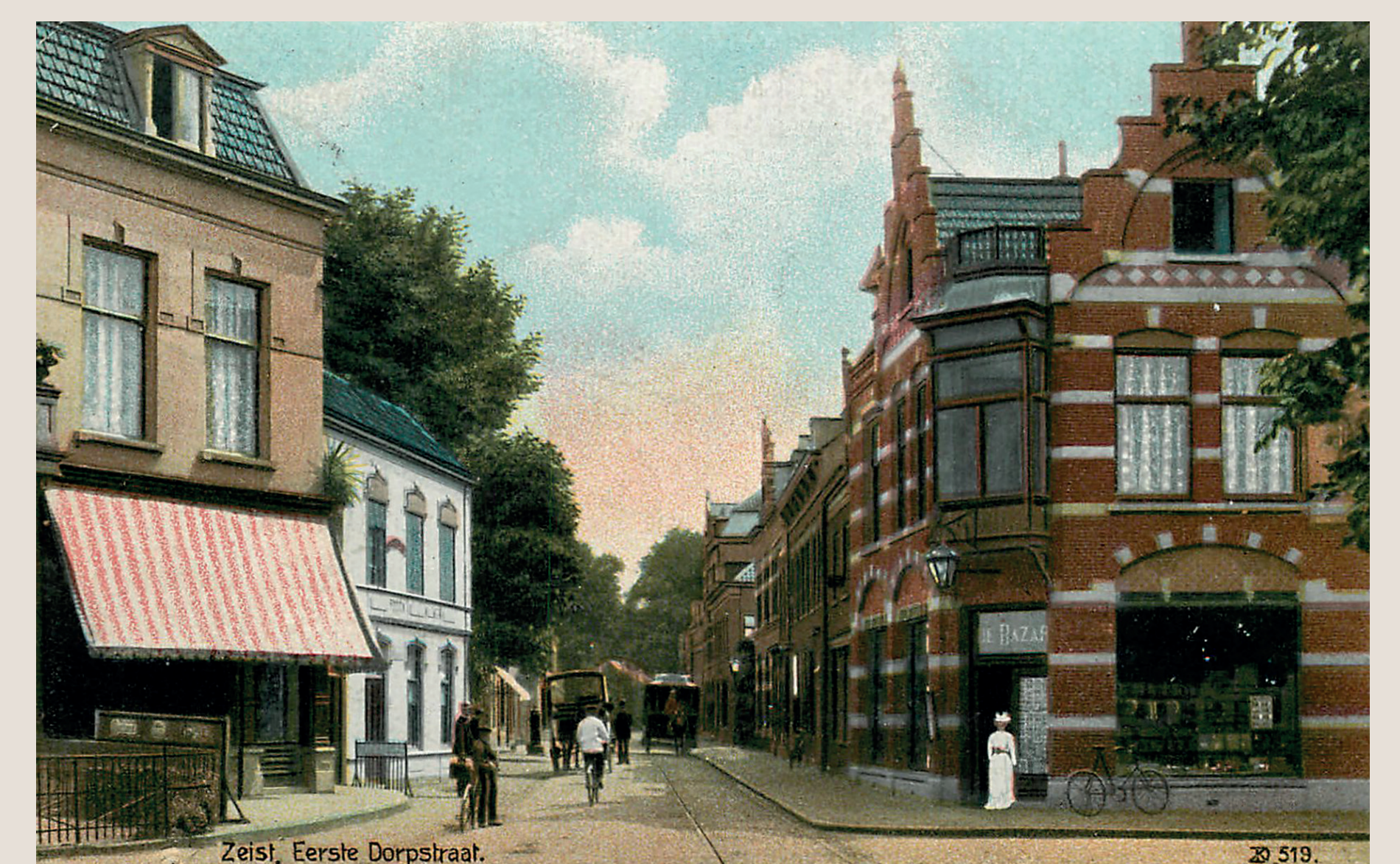
Hoek I e Dorpsstraat-Waterigeweg, begin 20 e eeuw