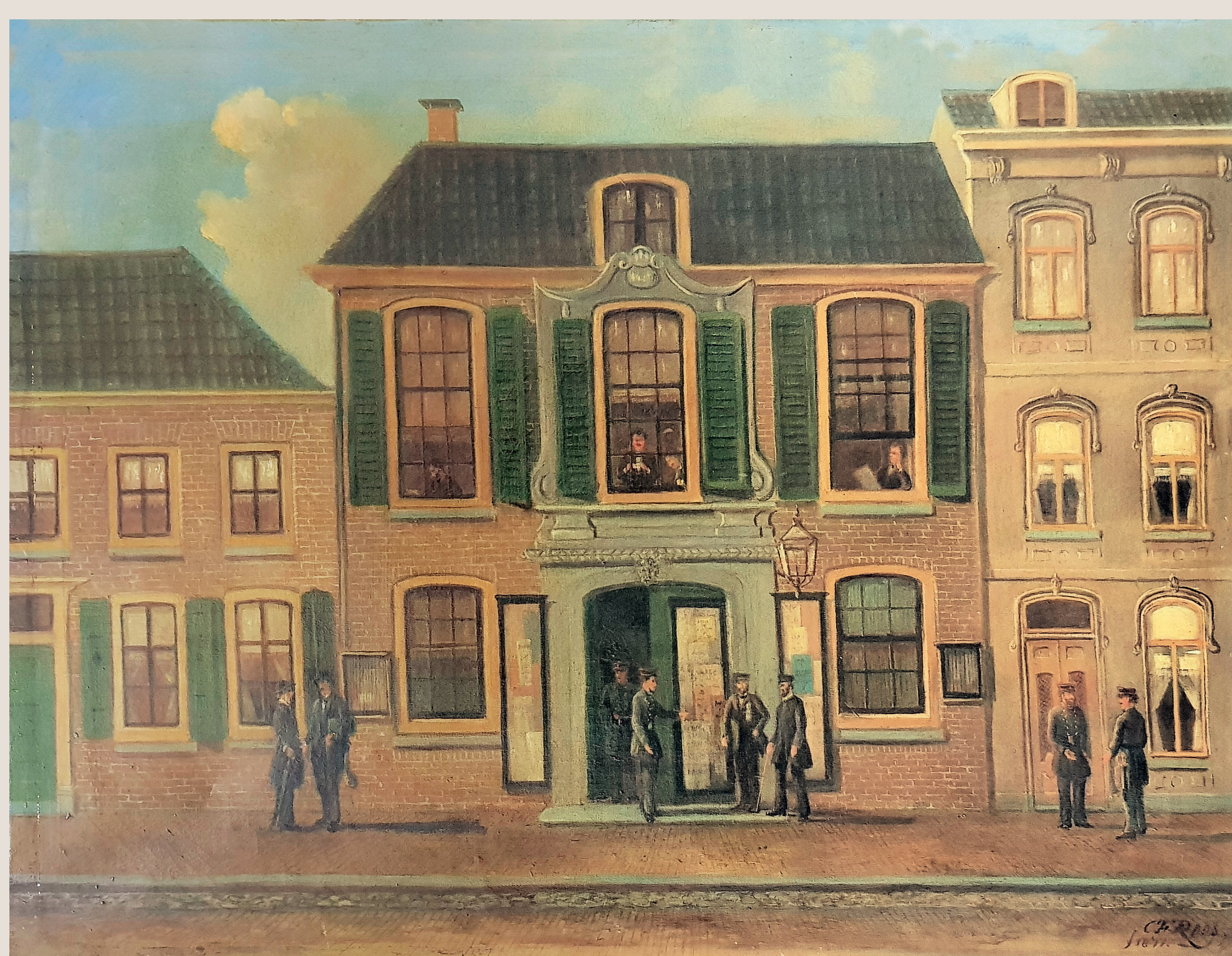
Het oude Regthuis van Zeist in de 19 e eeuw

De I e Dorpsstraat loopt van de Oude Kerk tot aan Het Rond. Al in 1368 wordt deze aangeduid als Strata de Zeijst . Dat betekent dat deze weg al heel vroeg is geplaveid, waarschijnlijk omdat een zijtak van de oorspronkelijke Rijn er vlak achter heeft gelopen. Mogelijk is de I e Dorpsstraat vroeger een kade geweest, hetgeen ook de lichte kromming in het tracé kan verklaren.