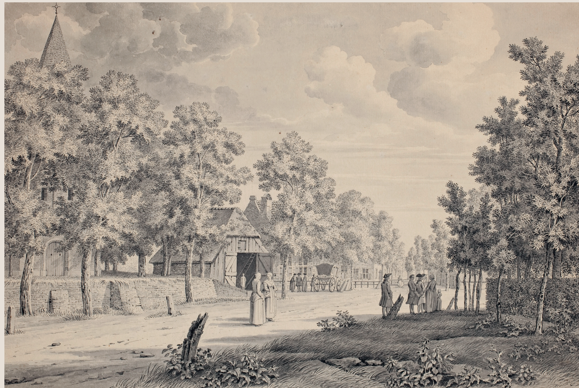
Gezicht op de Oude Kerk door Johannes de Bosch, 1748