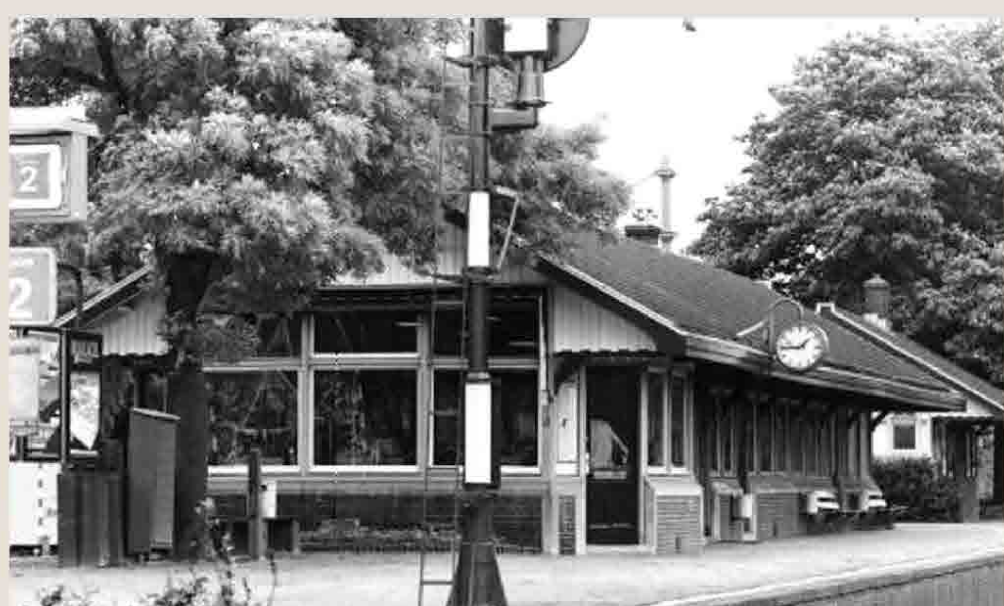
De sfeerbepalende beplanting met kastanjes ondersteunt de monumentale betekenis. Helaas is de goudes enige jaren geleden onaangekondigd gerooit!