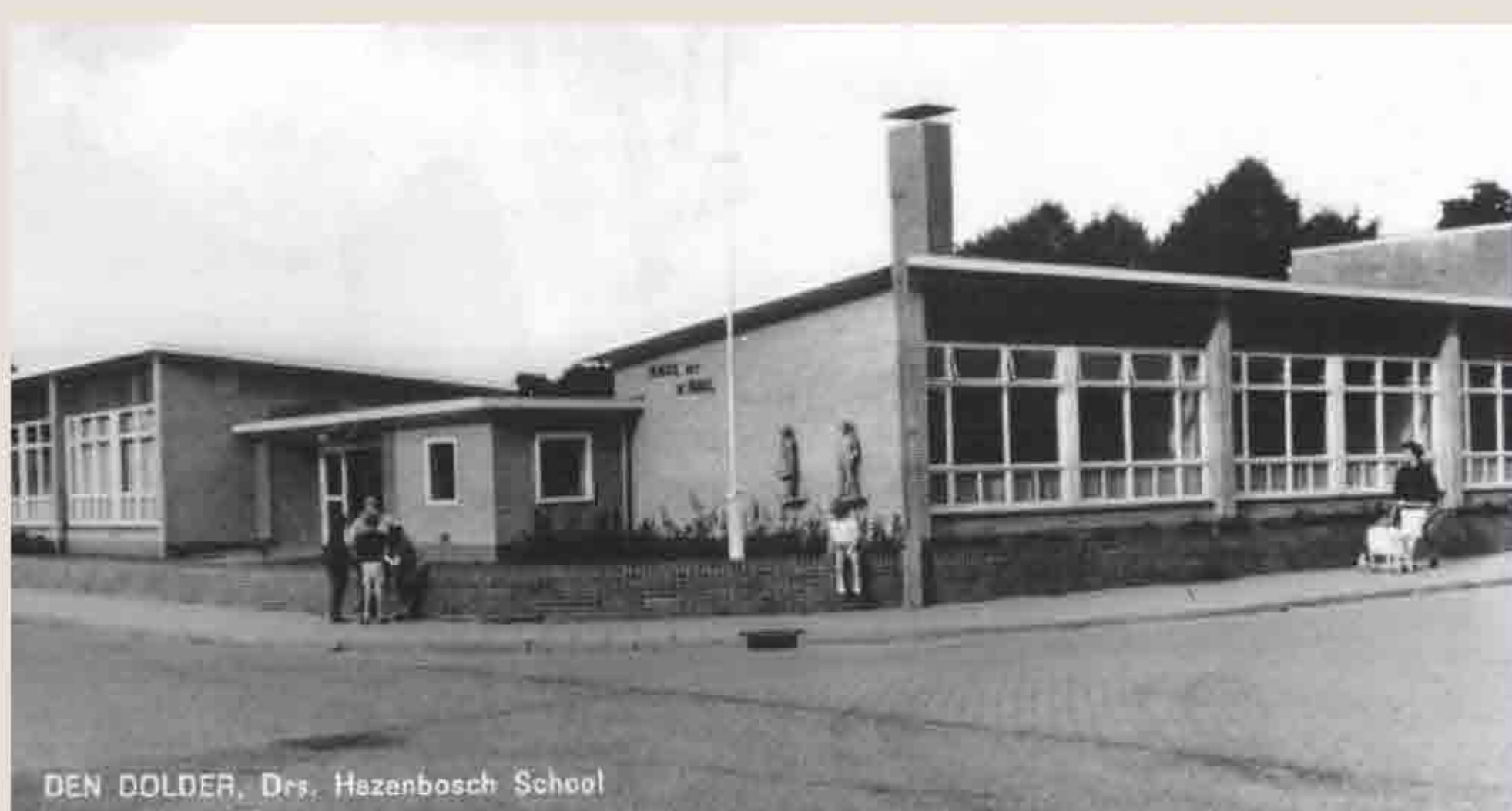
DEN DOLDER, Drs. Hazenbosch School