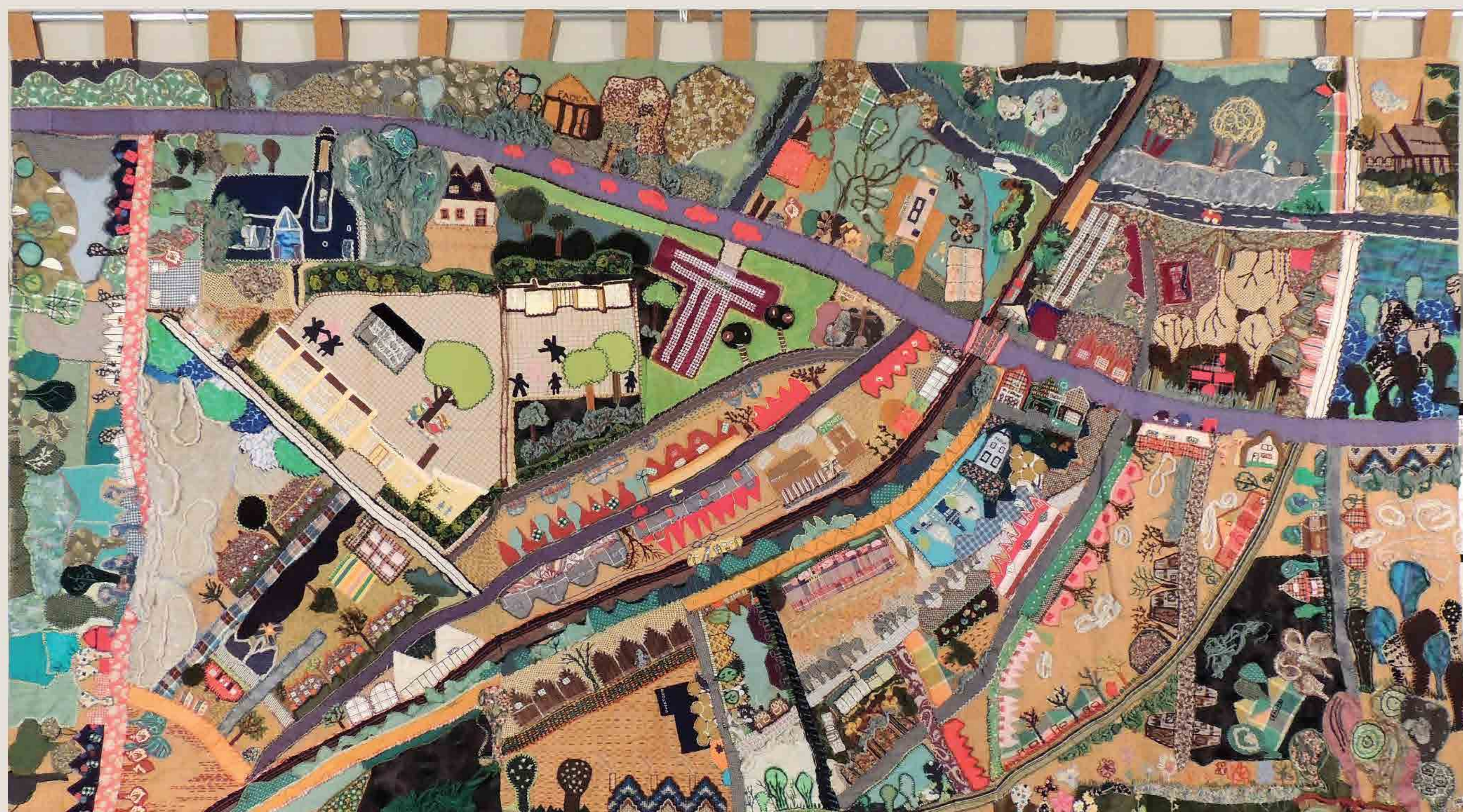
Het complete wandkleed.

De school is inmiddels gesloopt en op die plek is het appartementencomplex Hazenbosch verrezen. In samenspraak met de bewoners van het appartement ontstond het idee dit kunstwerk in bruikleen te geven en het te hangen op de openbare vide op de eerste etage. Zo blijft het niet alleen behouden maar is het ook te bewonderen door bewoners en bezoekers. Op 25 augustus 2017 is het kleed feestelijk onthuld in aanwezigheid van de meeste moeders uit die tijd. Op dit wandkleed staan ook de twee beeldjes die toen aan de gevel van de school hingen. Zij verbeelden een schooljongen en een schoolmeisje en ze zijn gemaakt door beeldend kunstenaar Job Goldenbeld (1923-1997). Door gezamenlijke inspanningen van Belangenvereniging Den Dolder, Gemeente Zeist, Historische Vereniging Den Dolder en Seyster Veste zijn deze beeldjes nu geplaatst op de gevel van dit gebouw. Ook zo blijft de geschiedenis van deze plek zichtbaar.