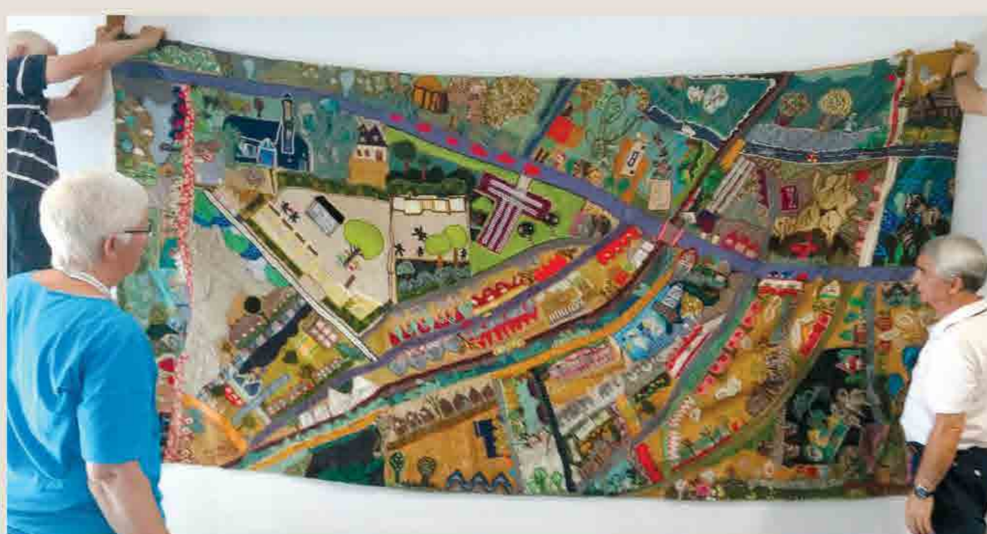
Het wandkleed op zijn nieuwe plek.