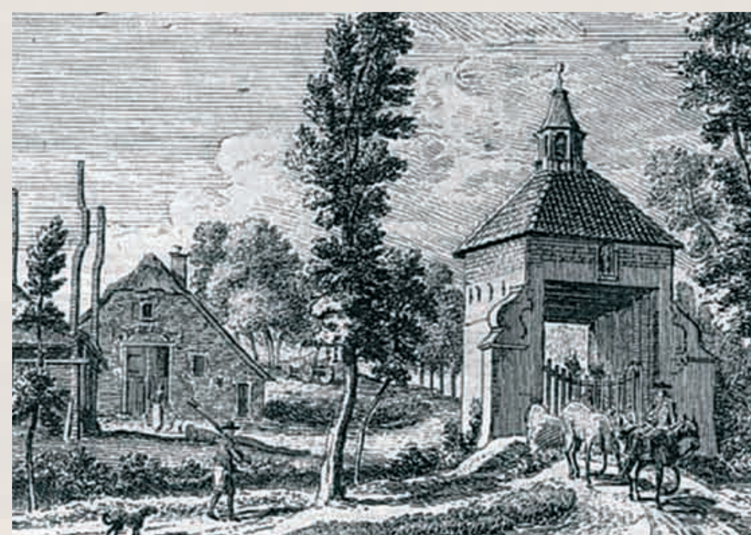
Gravure van de overblijfselen van Blikkenburg. Op de voorgrond de toegangspoort en op de achtergrond een oude boerderij, een voorloper van de huidige.