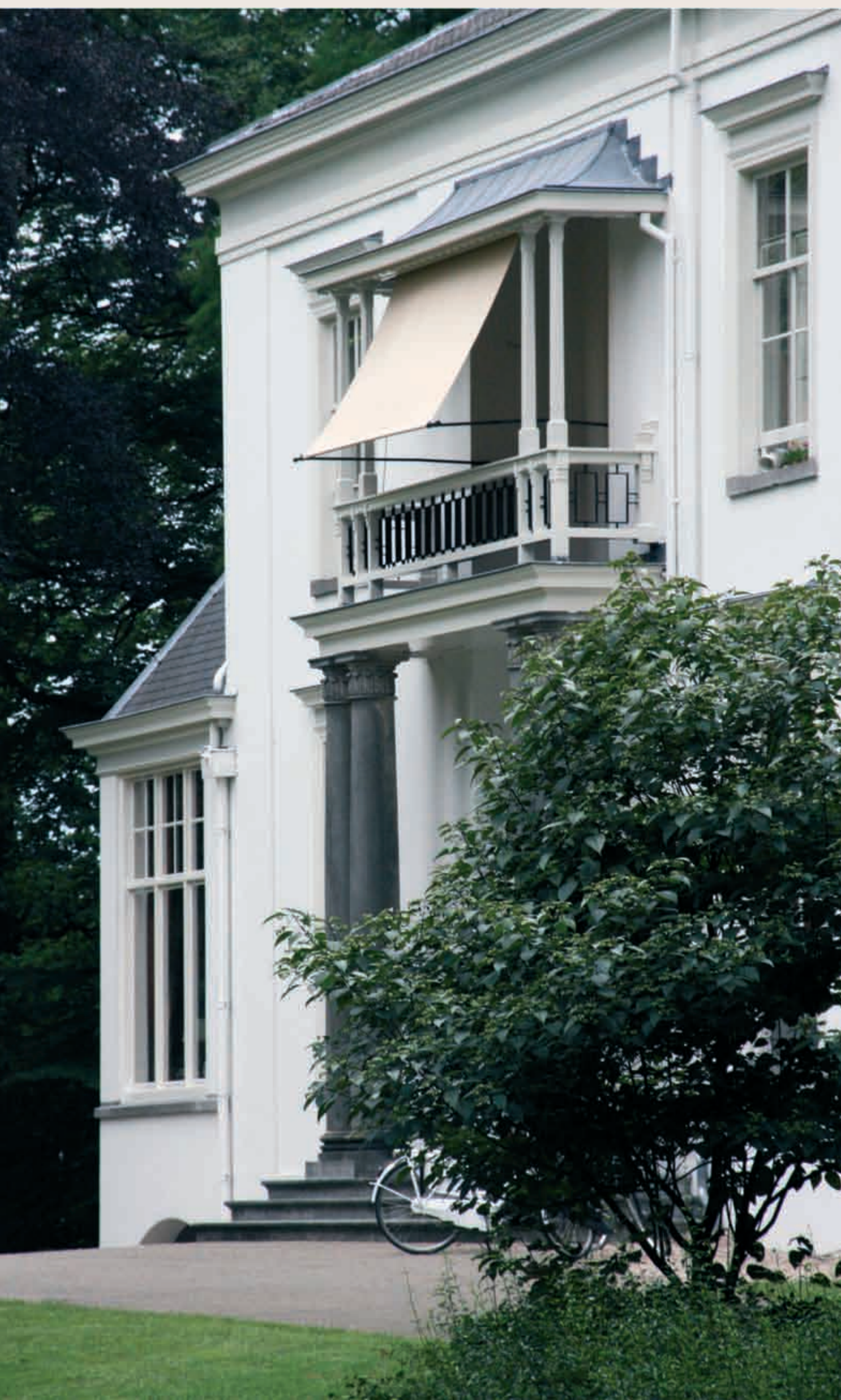
In 1829 werd de boerderij Blikkenburg samen met buitenplaats Wulperhorst gekocht door het echtpaar Huydecoper-Taets van Amerongen. Later kochten ze ook Slot Zeist en verbonden de drie locaties met elkaar door de aanleg van zichtassen. Rond 1850 werd landhuis Blikkenburg gebouwd door een van hun zonen.

Na de afdamming van de Kromme Rijn bij Wijk bij Duurstede (in het jaar 1122) werd de waterstand in de Stichtse klei- en veengebieden beheersbaar. Er kon worden begonnen met de ontginning van deze moerassige gronden. In de 13de en 14de eeuw werden langs de rand van deze middeleeuwse ontginningen een aantal versterkte huizen gebouwd: Zeist, Blikkenburg, Kersbergen en mogelijk ook De Brakel. Waarschijnlijk waren dit huizen van geslaagde ontginners.