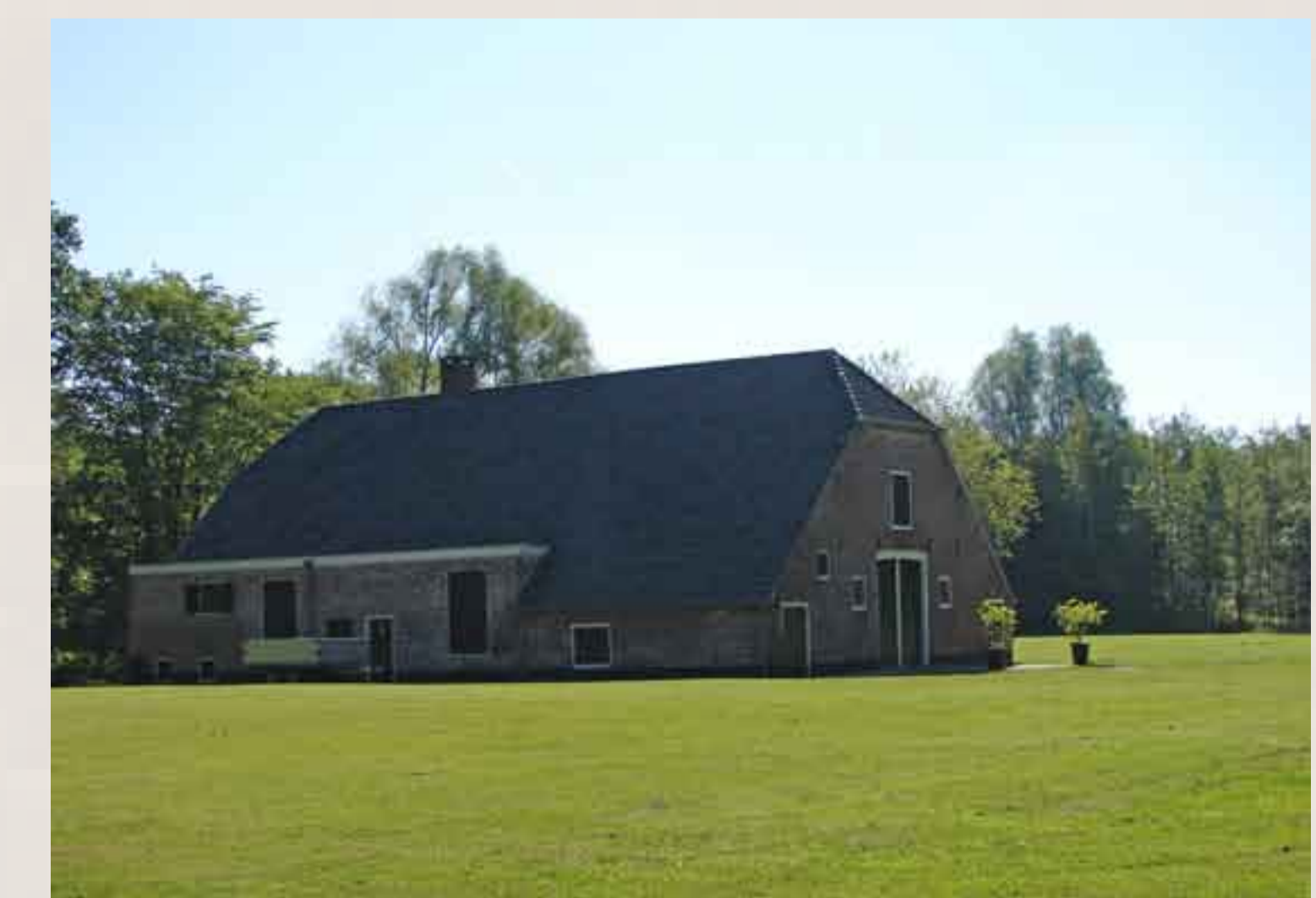
Willem Adriaan van Nassau, de bouwheer van Slot Zeist kocht ook dit stuk grond aan. De Blikkenburgerlaan werd opgenomen in het door hem aangelegde lanenstelsel bij het Slot. Waarschijnlijk is de huidige boerderij begin negentiende eeuw gebouwd op de plaats waar eerder al een boerderij stond.

U kunt het verhaal van Zeist beluisteren in MP3 met de audiotour, kosteloos te downloaden via: www.museumkwartierslotzeist.nl of www.zeist.nl . De audiotour is te koop bij de VVV, Hotel Theater Figi en Slot Zeist. De QR-codes op locatie maken de beschikbare MP3-bestanden toegankelijk voor de smartphone.