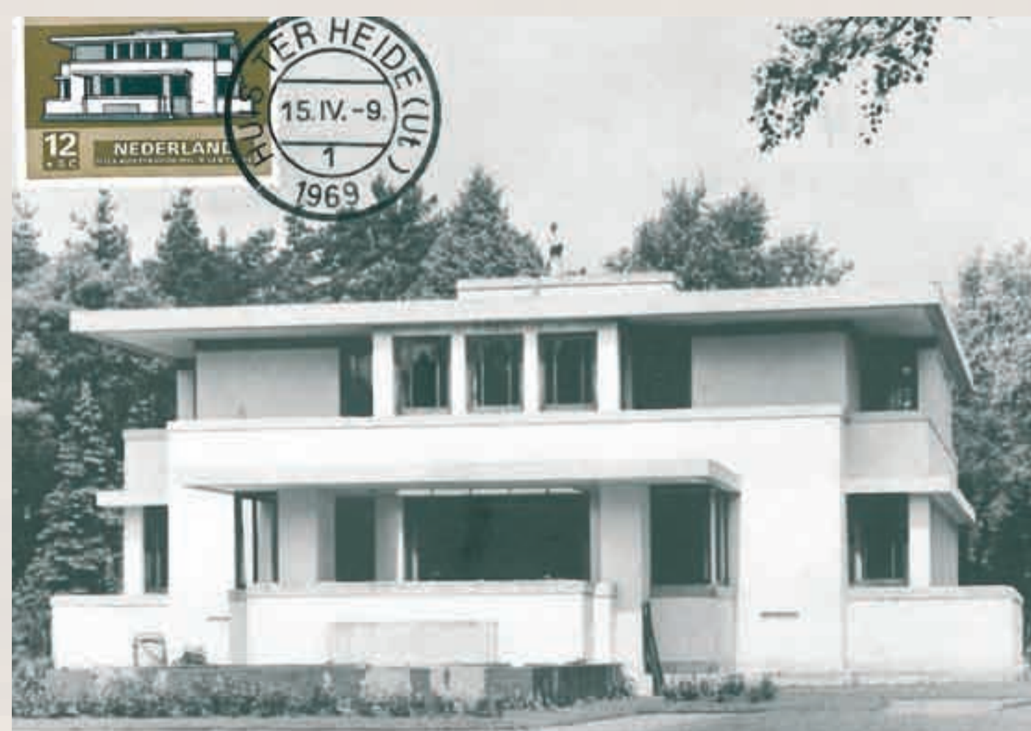
Villa Henny is wit en heeft een plat dak: in 1919 zijn dit kenmerken van ultramoderne architectuur. Het huis ernaast, van dezelfde architect, is juist heel traditioneel. Het is genoemd naar een lieflijk dalletje: Løvdalla. Het heeft steile zadeldaken, een houten gevel en hoge schoorstenen zoals in de Engelse landhuisbouw. Aan de postzegel op de kaart is te zien welk huis het meest beroemd is geworden.

U kunt het verhaal van Zeist beluisteren in MP3 met de audiotour, kosteloos te downloaden via: www.museumkwartierslotzeist.nl of www.zeist.nl . De audiotour is te koop bij de VVV, Hotel Theater Figi en Slot Zeist. De QR-codes op locatie maken de beschikbare MP3-bestanden toegankelijk voor de smartphone.