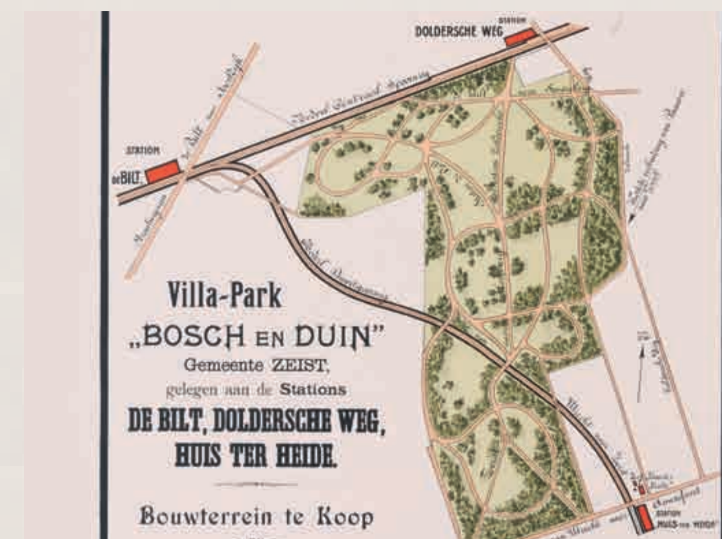
De goede bereikbaarheid van de bouwgrond van het villapark Bosch en Duin wordt als grootste pluspunt in het affiche naar voren gebracht. Maar liefst drie stations omringen de fraaie, groene woonomgeving: de stations van De Bilt, Den Dolder en Huis ter Heide.