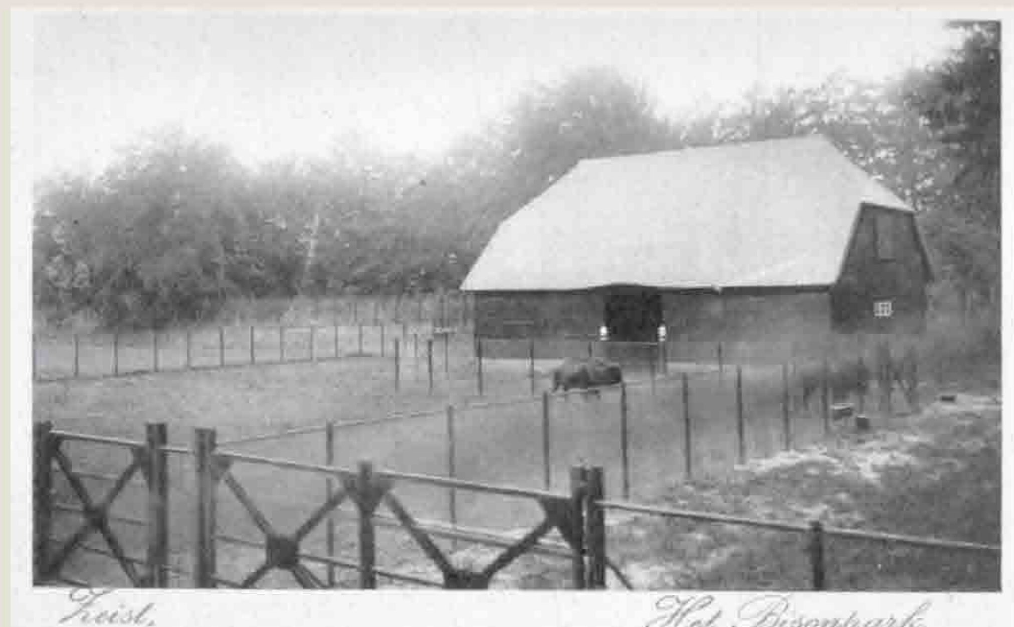
prentbriefkaart Bisonpark 1927