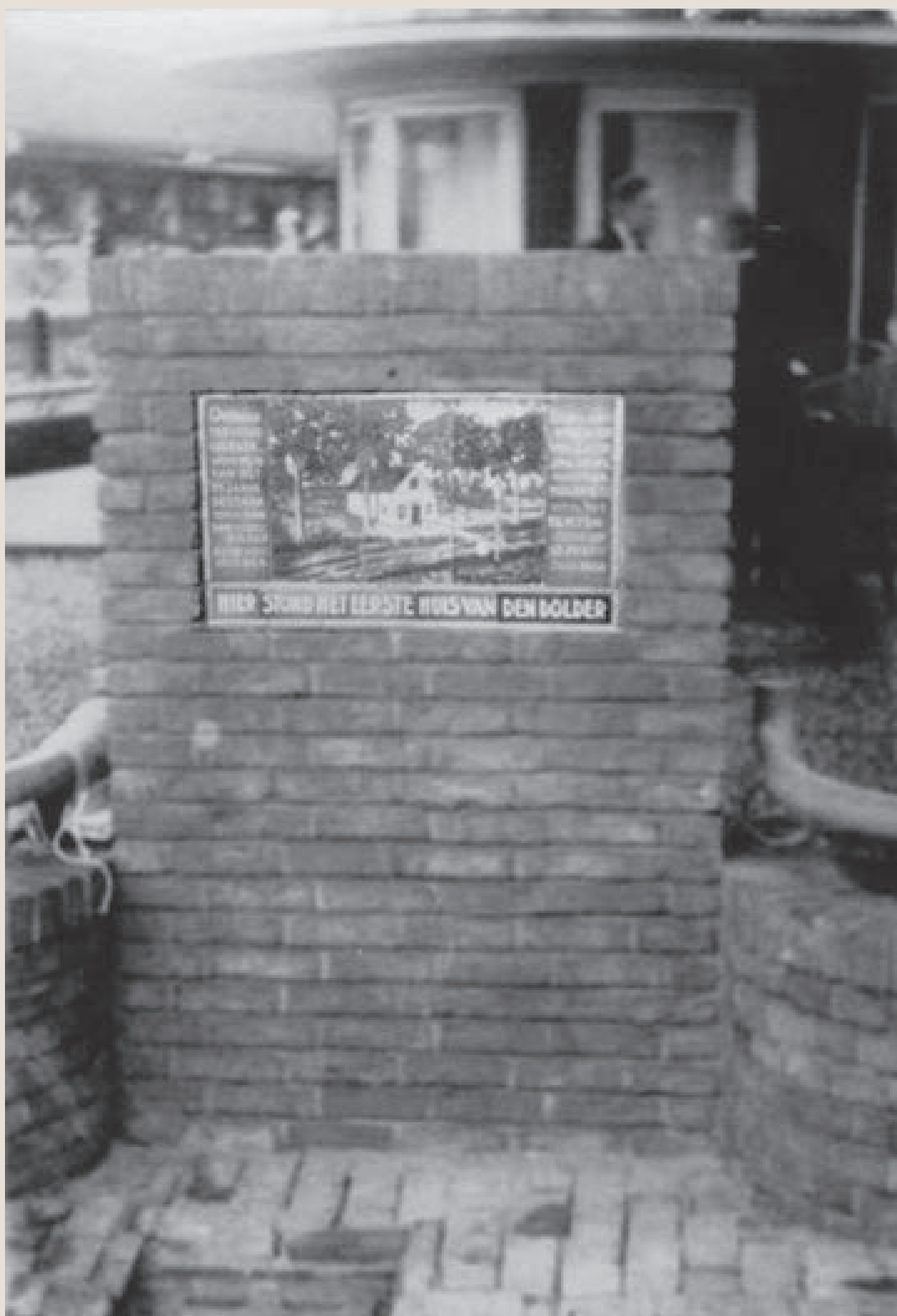
Het originele tegeltableau in de muur van Hotel Hiensch in 1938