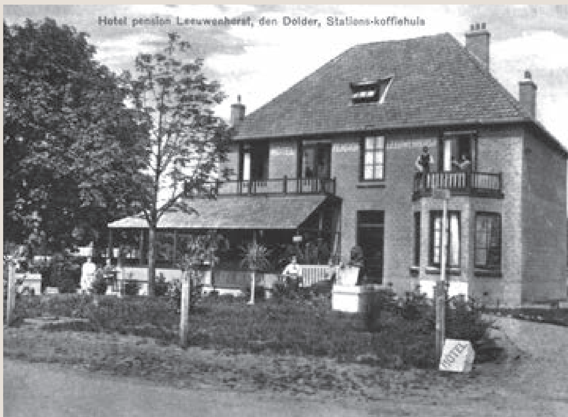
Hotel-pension Leeuwenhorst in 1916