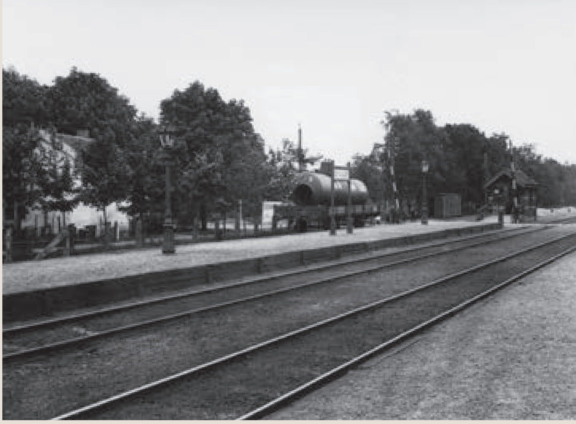
Stopplaats Dolderscheweg met links de tolgaarderswoning in 1911