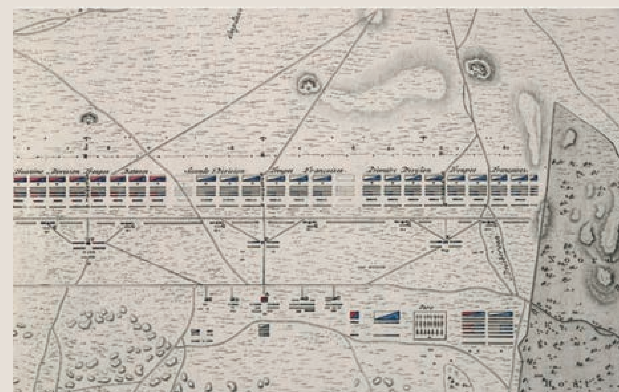
Kenmerkend is de hiërarchische opbouw van het kamp. Onderaan de tenten van generaal De Marmont (A) en zijn staf, dan de divisiegeneraals (F) en de brigadegeneraals (G) en tenslotte de onderofficieren en de manschappen, verdeeld over drie divisies.