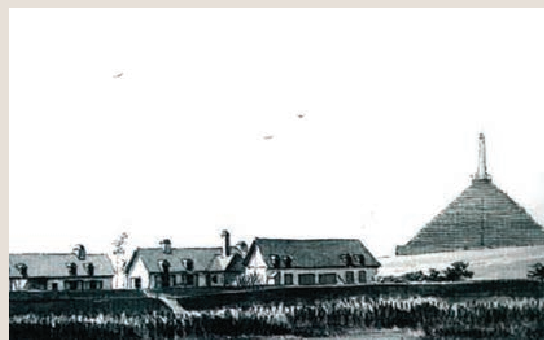
De Pyramide van Austerlitz met de drie bewakershuisjes, Otto Howen, 1807.