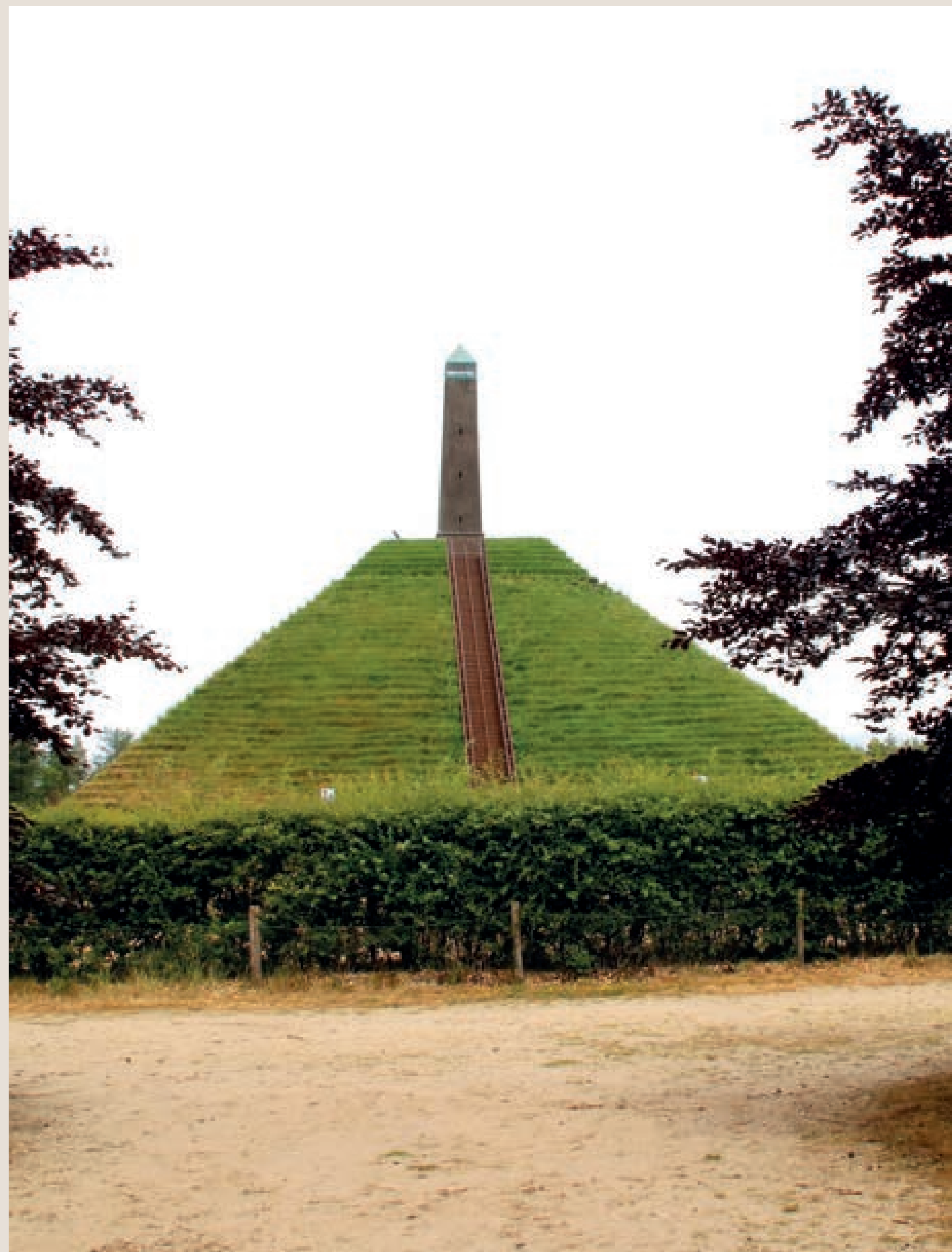
De huidige Pyramide van Austerlitz. Al vrij snel na de bouw werd de Pyramide een toeristische attractie.

Austerlitz is ontstaan in de Franse tijd (1795-1813), toen de Franse legers Nederland bezetten. Een van de Franse legerkorpsen was ingekwartierd in de stad Utrecht en stond onder bevel van generaal De Marmont. De generaal besloot een geschikte plaats te vinden voor een legerkamp op de grote heide ten westen van Zeist. Bij het archeologisch onderzoek in 2017-2018 is veel informatie gevonden van dit voormalige kamp, zoals paalsporen van gebouwen die uit hout waren opgetrokken en militaire vondsten zoals regimentsknopen en musketkogels.