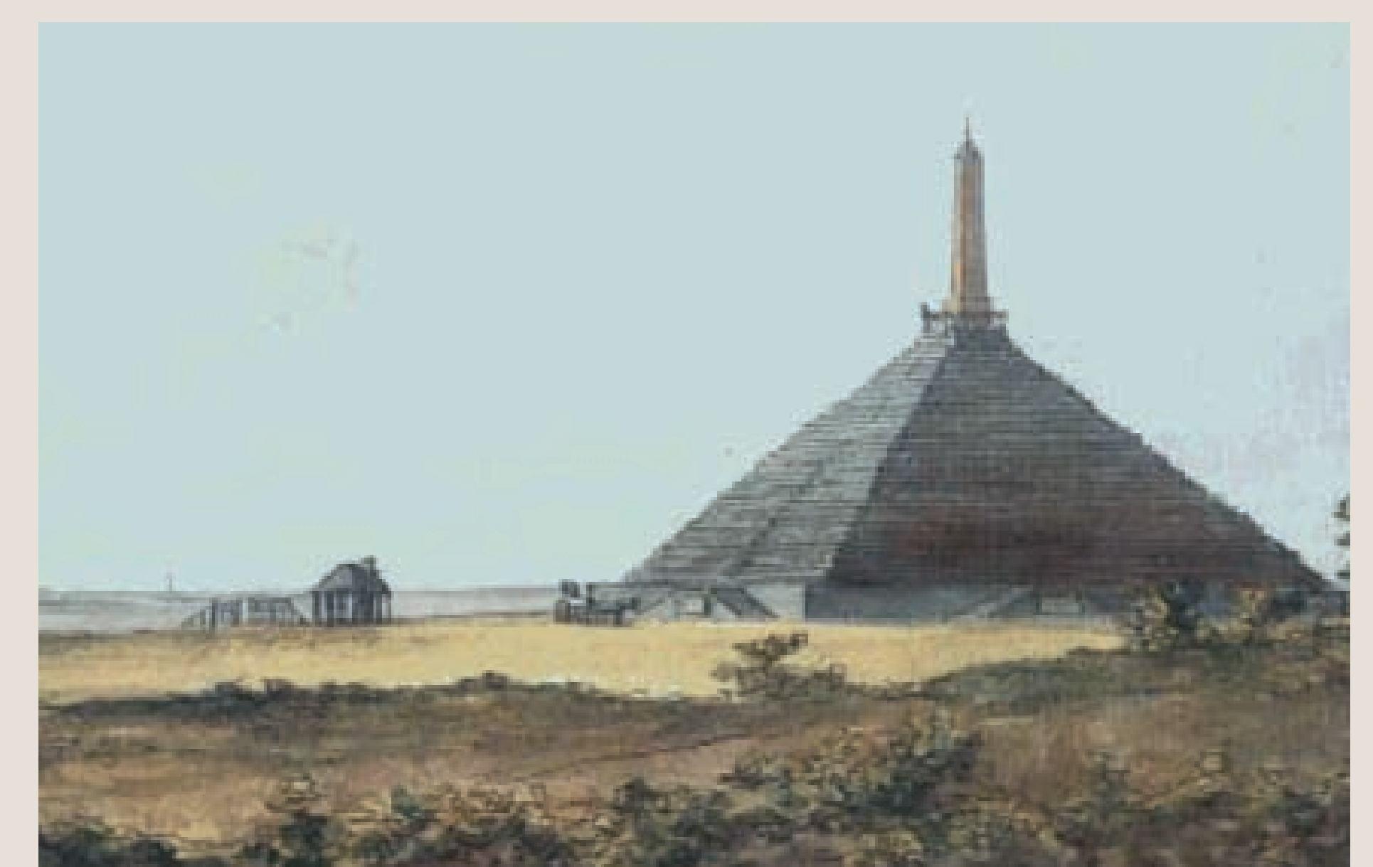
'Camp d'Utrecht' met de trappenpyramide. De houten obelisk werd in 1894 vervangen door een gemetselde toren met uitkijkpost. Gewassen pentekening in kleur, Otto Howen 1807.

Dit informatiebord maakt deel uit van een serie borden bij cultuurhistorische bezienswaardigheden in Zeist, Austerlitz, Bosch en Duin, Huis ter Heide en Den Dolder. De informatie op deze borden is namens de erfgoedpartners samengesteld door het Zeister Historisch Genootschap, Stichting het Gilde, Stichting Lokaal Austerlitz en de gemeente Zeist.