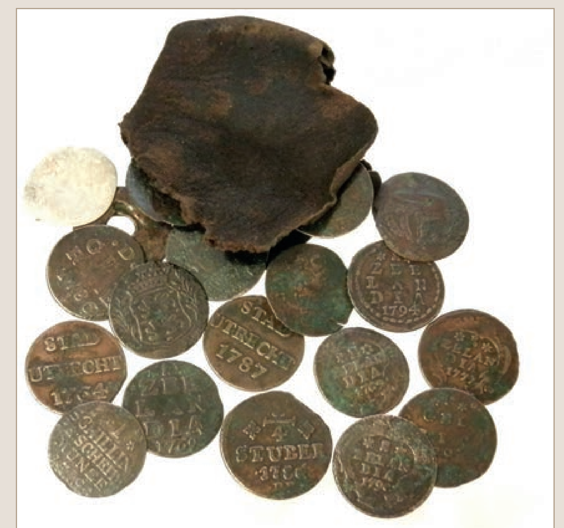
Buidel met munten, gevonden tijdens de opgravingen.