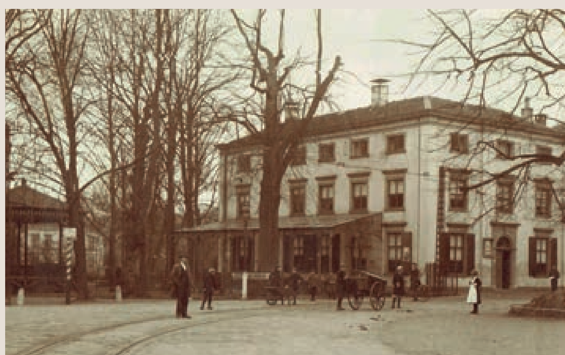
Vormalig Logement der Broedergemeente, later Hermitage, in ca. 1910

Bij de aanleg van Slot Zeist aan het eind van de 17 e eeuw wordt een rond plein aangelegd op de kruising van de gloednieuwe oprijlaan met de eeuwenoude Dorpsstraten. Dit plein wordt het Rondeel genoemd. Pas in 1956 wordt Het Rond de officiële naam. Op een kaart uit 1802 is de ronde vorm nog goed te herkennen.