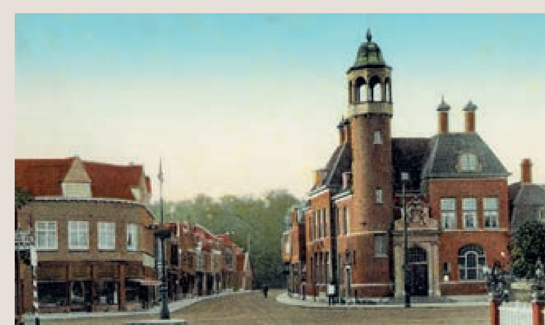
Zicht op de 2 e Dorpsstraat vanaf het Rond in ca. 1925 met links Figi en rechts het postkantoor