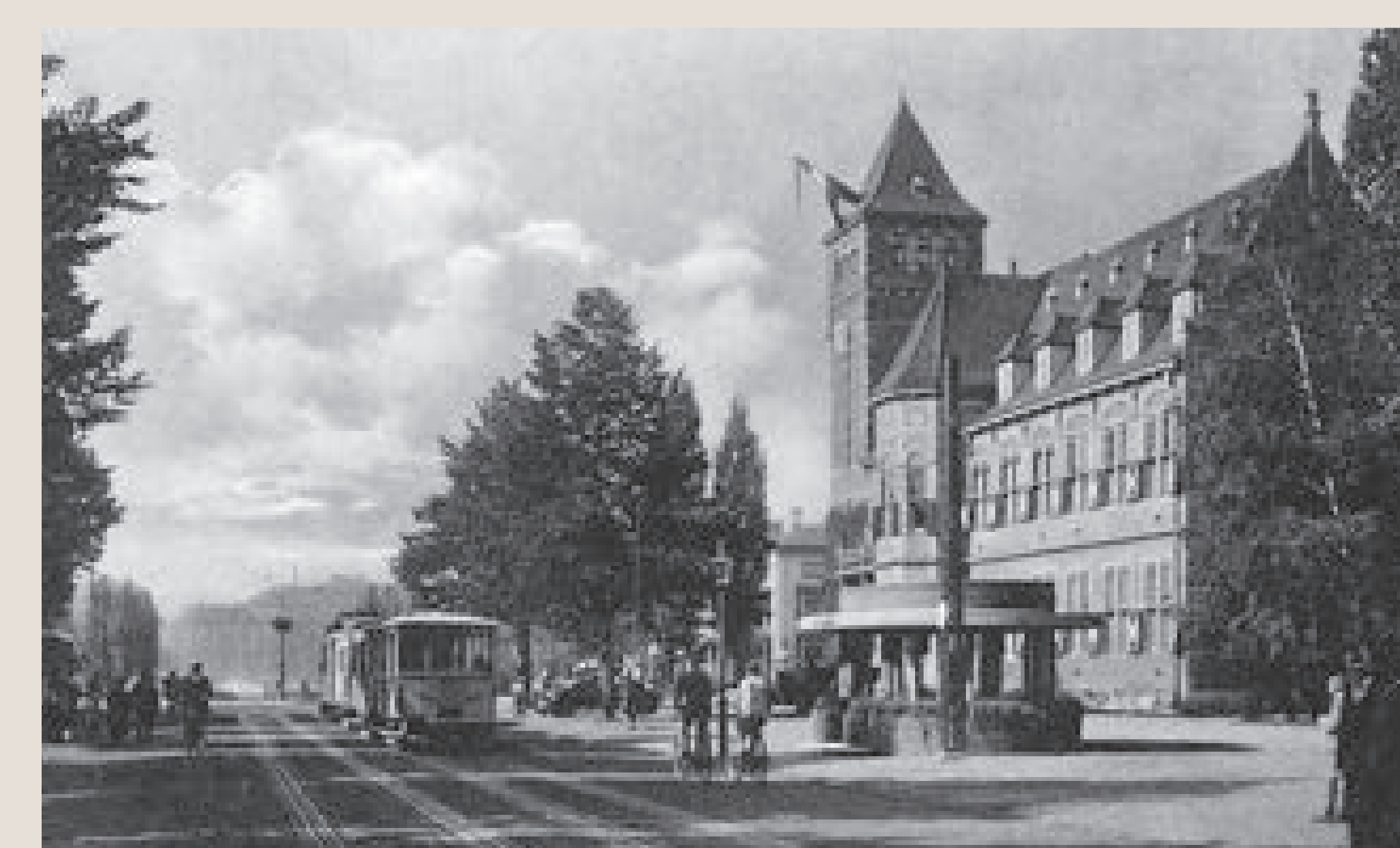
Het gemeentehuis met de tram en het wachthuisje