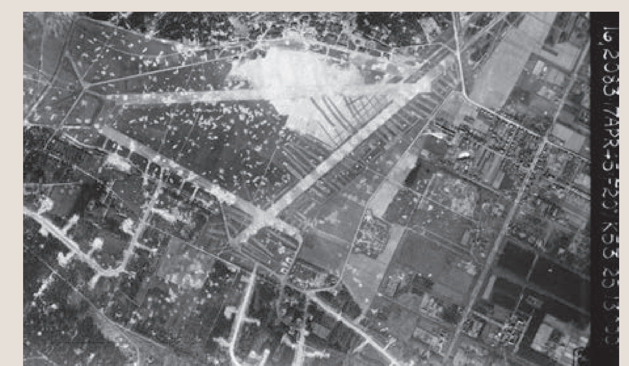
RAF-luchtfoto van Vliegerhorst Soesterberg, genomen op 17 april 1945. Het noorden ligt links. Overal zijn inslagplekken van bommen te zien.