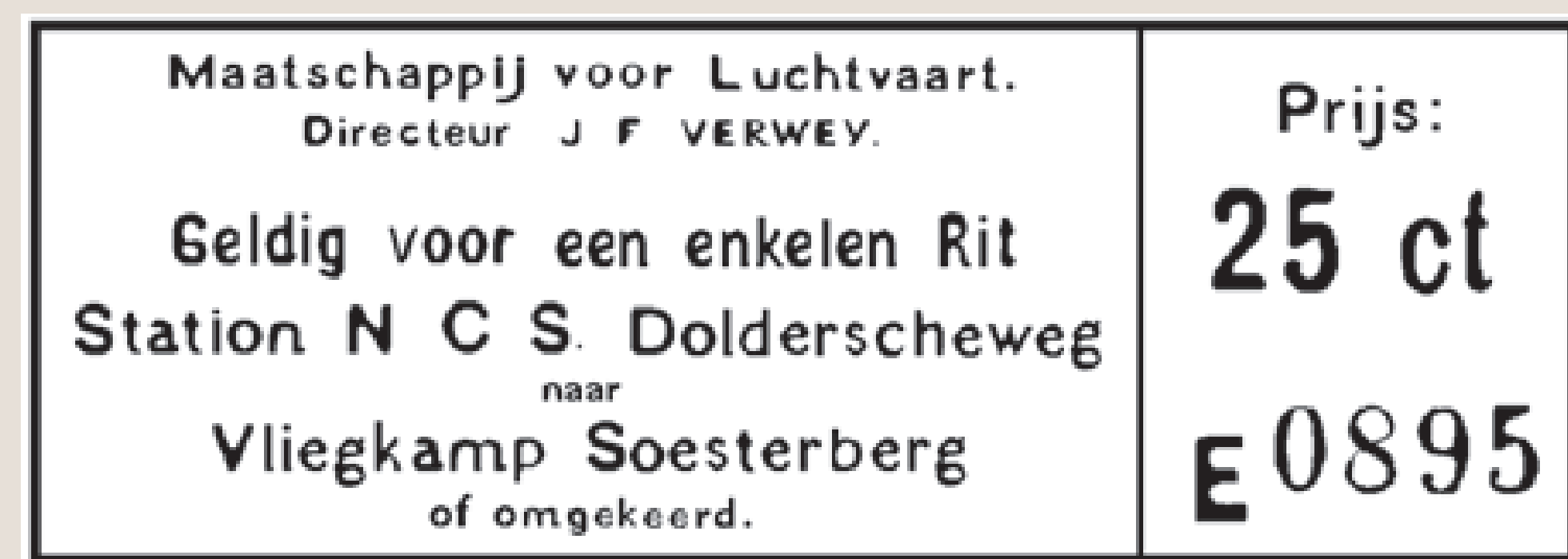
Tramkaartje voor de rit van Den Dolder naar het Vliegveld