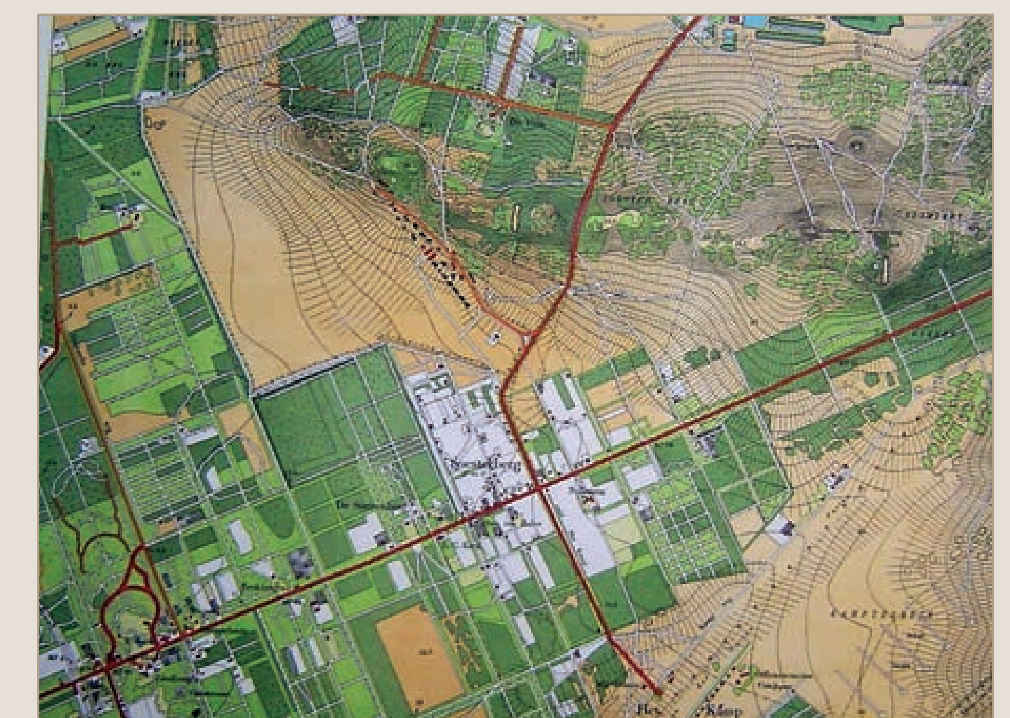
Militaire Krijgsspelkaart uit 1913 met de eerste vliegveldgebouwen