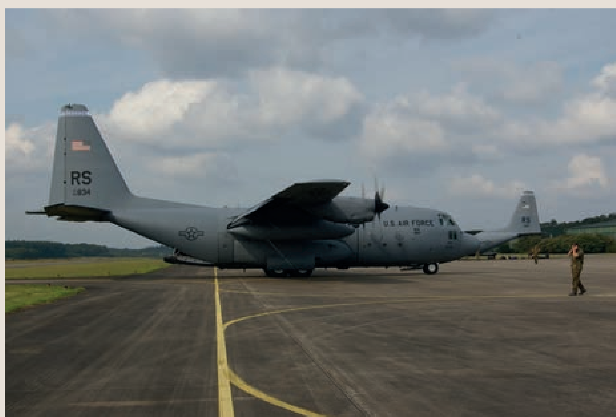
Amerikaanse aanwezigheid op vliegbasis Soesterberg, foto uit 2008