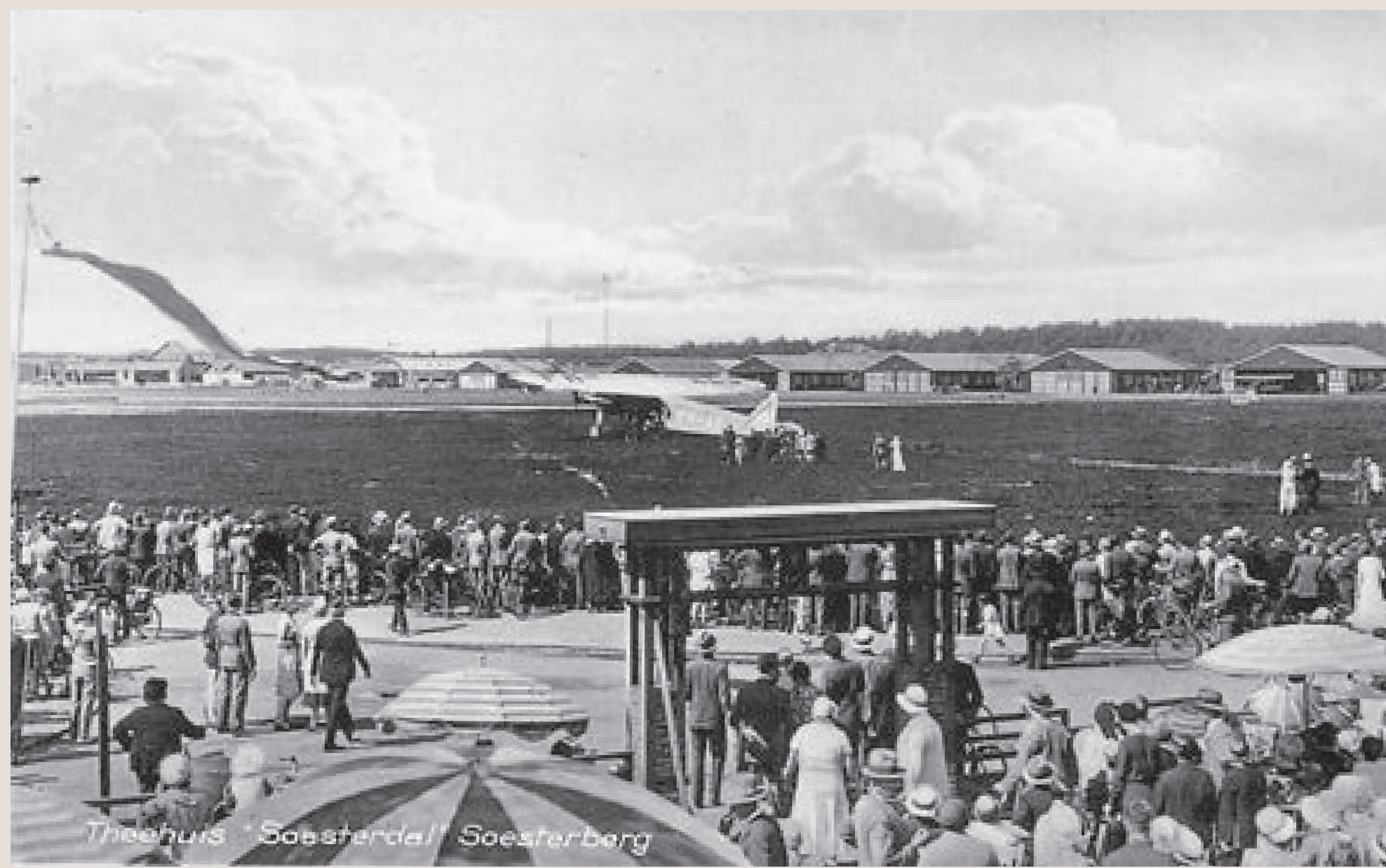
Grote belangstelling voor de eerste vliegpijners op Soesterberg