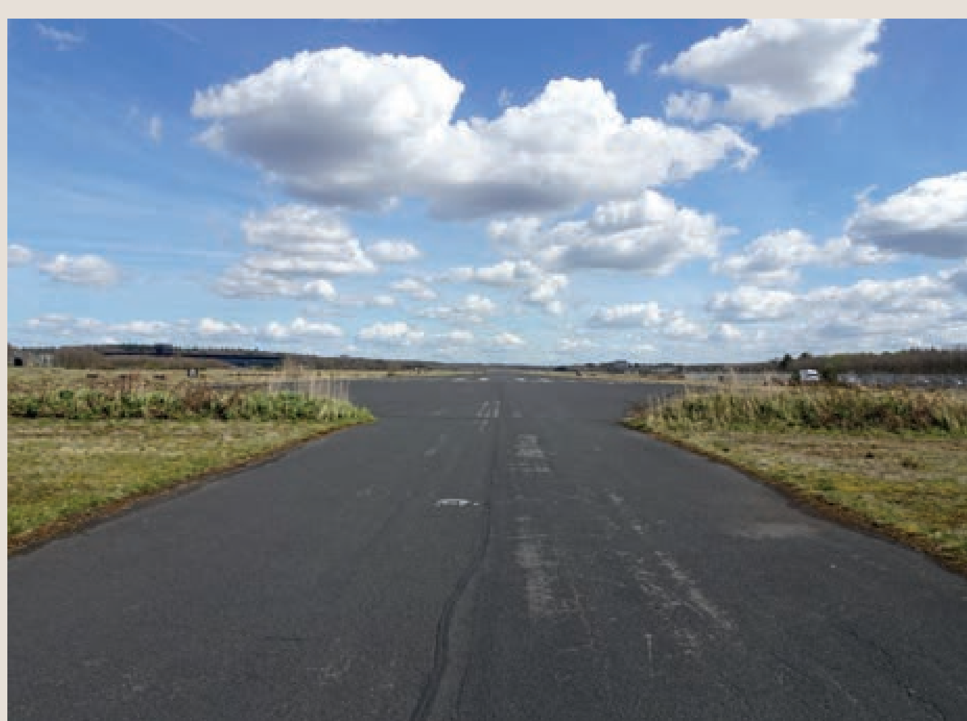
De start- en landingsbaan van de voormalige vliegbasis, foto uit 2019 van Bert van Eerten (Bron: Historische Vereniging Den Dolder)

De vlieggeschiedenis van Soesterberg begint in 1908 als W.H. Schukking, Luitenant der Genie, hier de eerste zweefvlucht boven Nederland maakt.