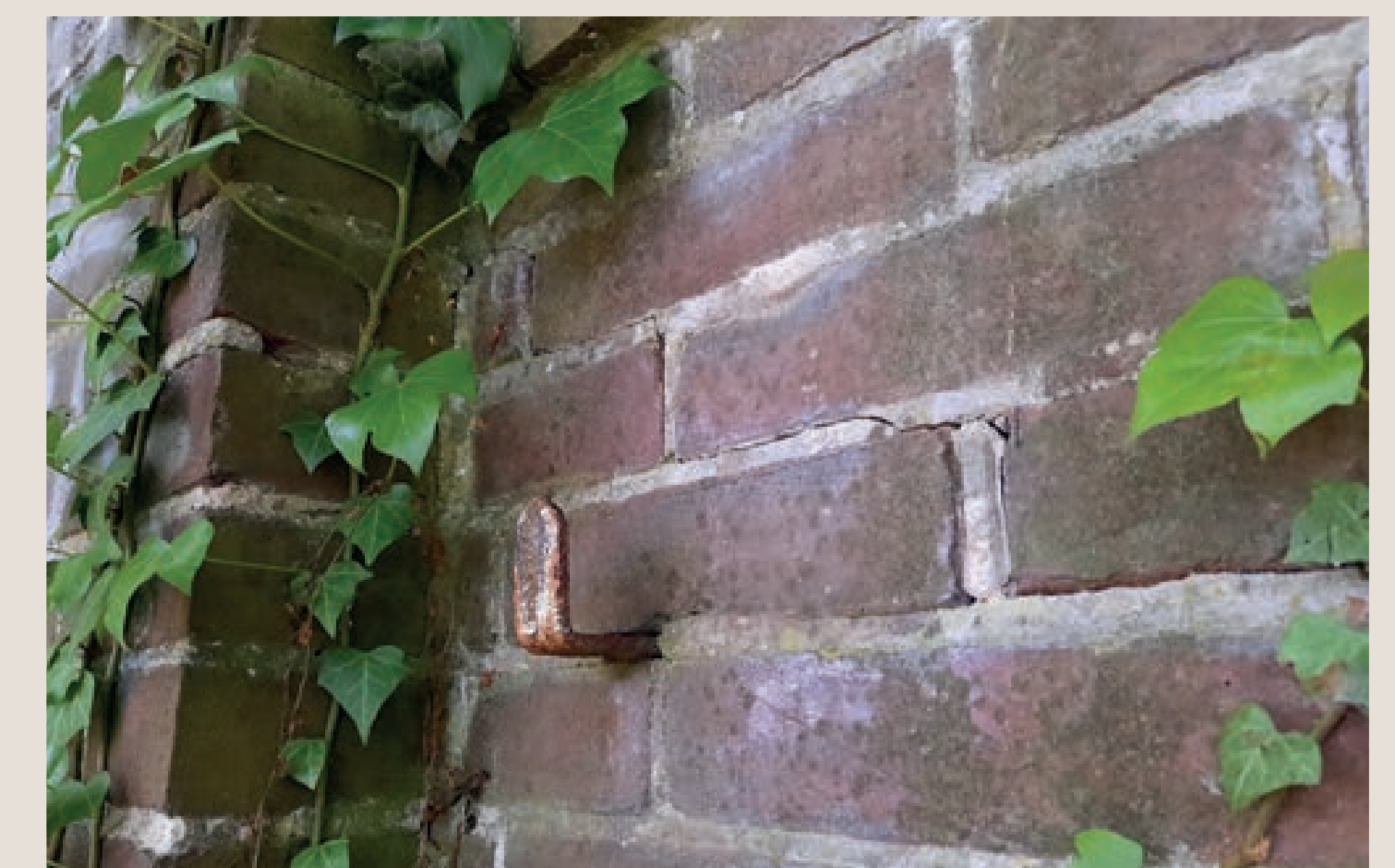
Tuinmuur uit ca. 1900 met fruitrekhaak