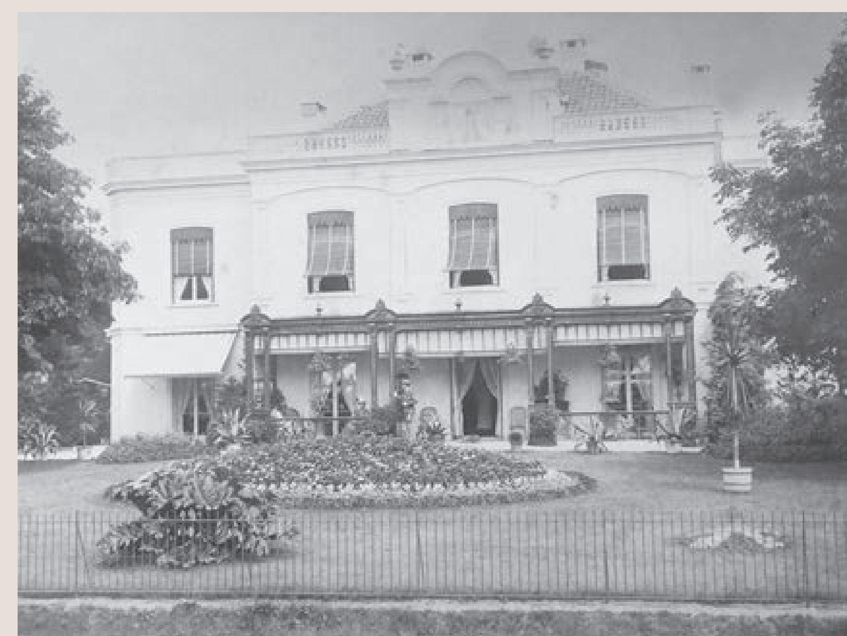
Villa Nuova