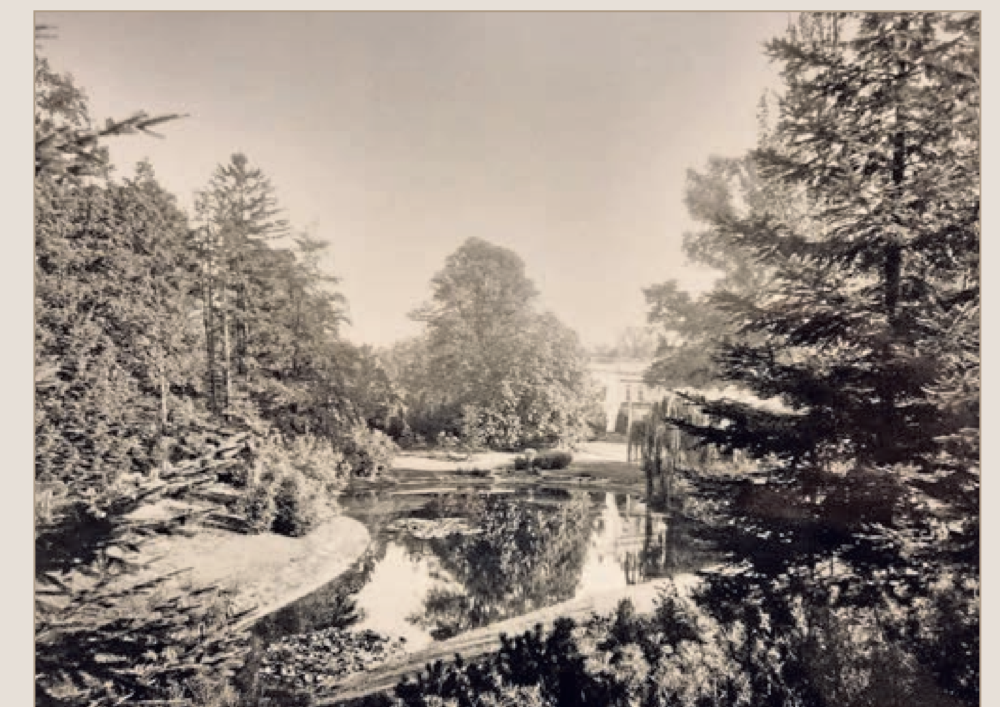
Vijver Nuova met zicht op het huis