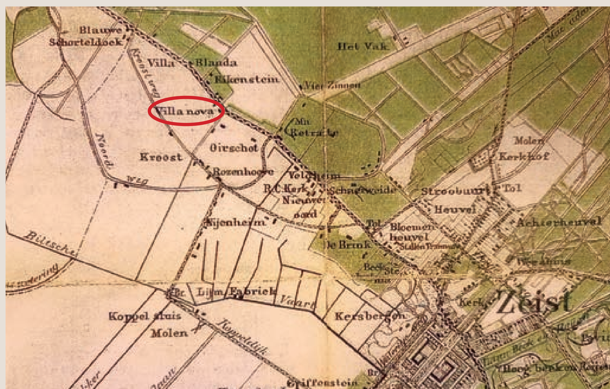
Wandelkaart Zeist (detail), ca. 1870. Villa Nuova ligt binnen het kader

De aanleg van het Pesterebosje blijft tot in de jaren 60 van de 20e eeuw intact. Daarna raakt het verwaarloosd. Gelukkig hebben omwonenden en de gemeente Zeist het park enkele jaren terug een opknapbeurt gegeven. Zo blijft dit historische groen van grote waarde voor de omgeving.