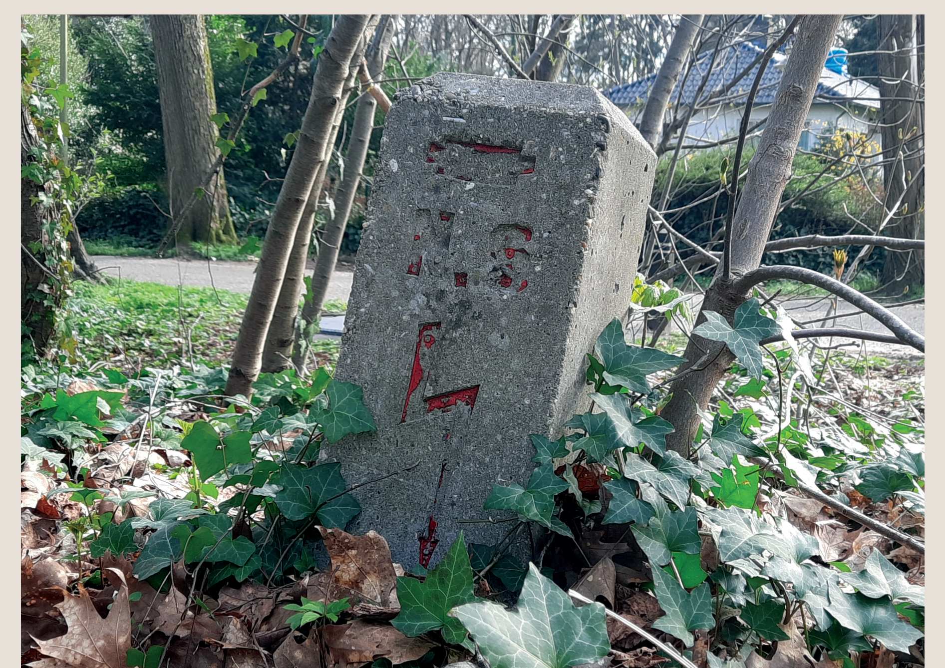
Stroompaaltje NS langs voormalige spoorlijn