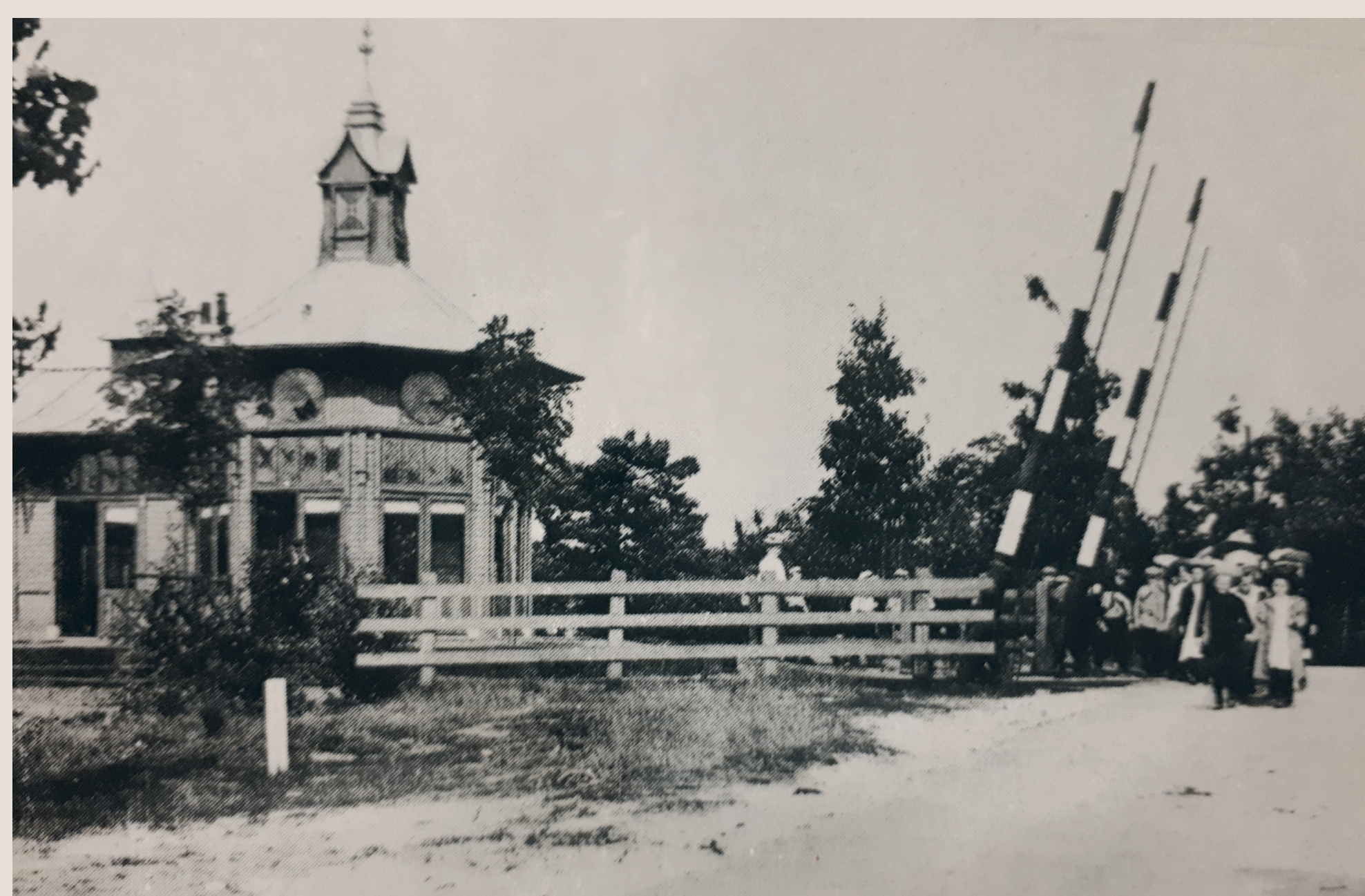
Station Bosch en Duin met de kiosk, 1923

De villawijk Bosch en Duin ontstaat vanaf 1902. Rijke kooplieden uit de stad kopen hier grote kavels onontgonnen terrein om huizen op te bouwen, eerst vooral als zomerverblijf en later voor permanente bewoning. De frisse buitenlucht en goede bereikbaarheid trekken ook herstellingsoorden en vakantiekolonies naar dit gebied toe.