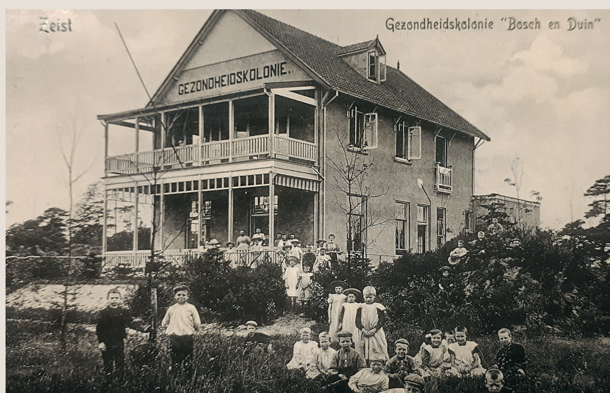
Gezondheidskolonie Bosch en Duin