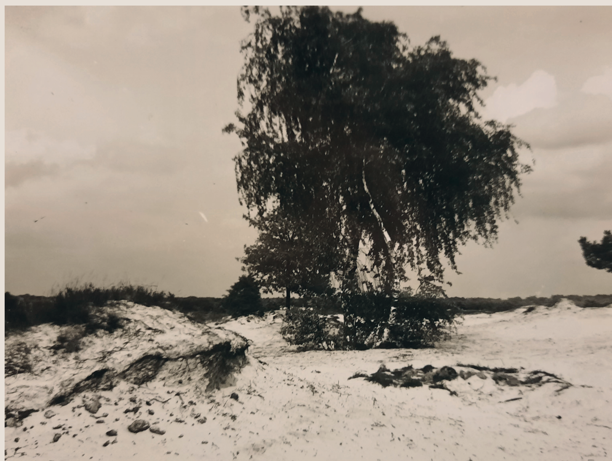
Het oorspronkelijke stuifduinenlandschap bij Bosch en Duin