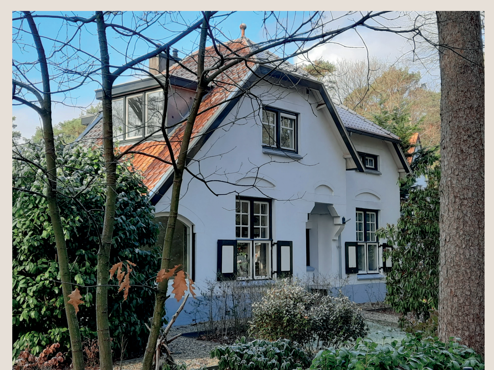
Dienstwoning haltechef station Bosch en Duin