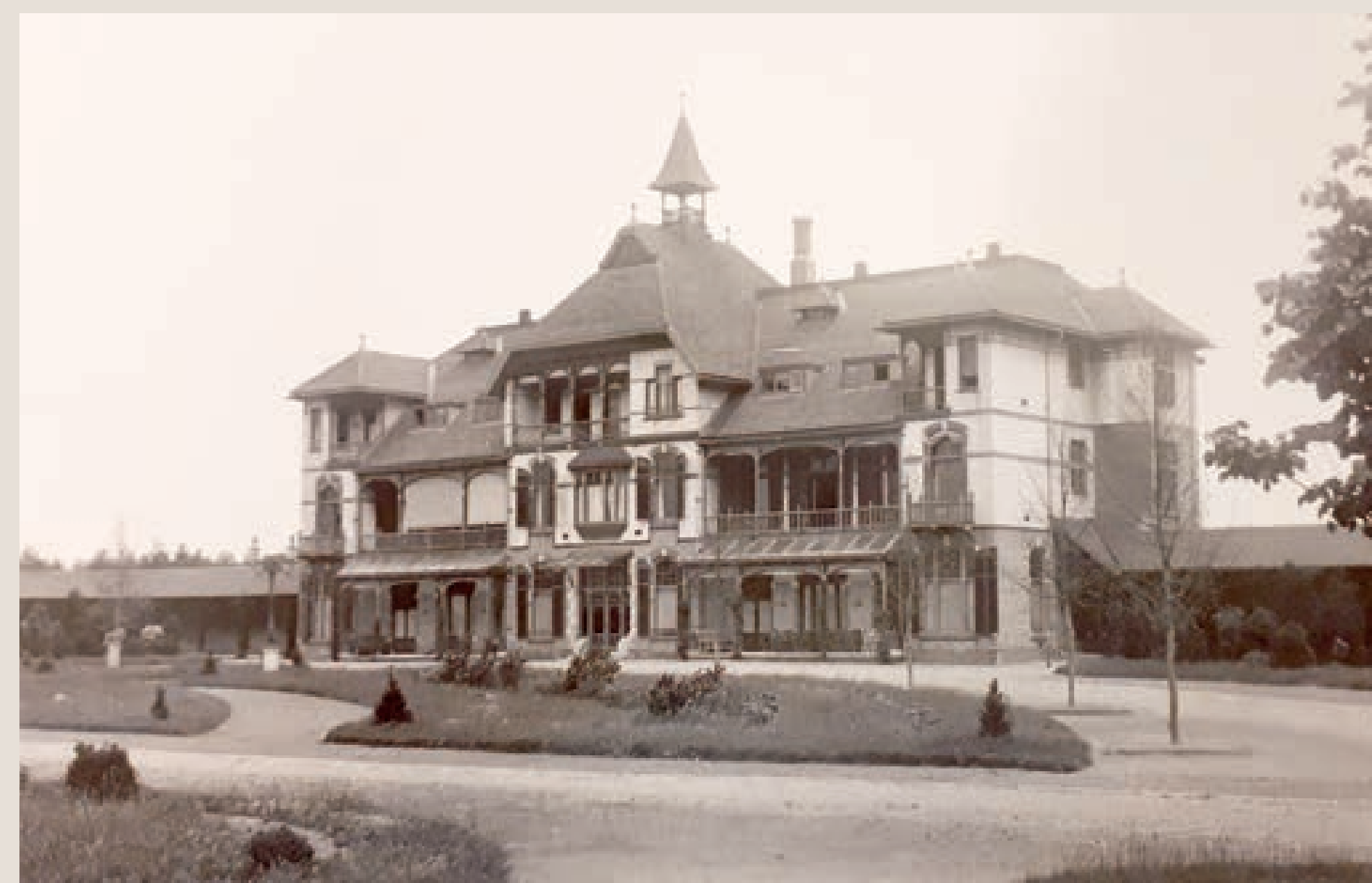
Christelijk Sanatorium, ca. 1905