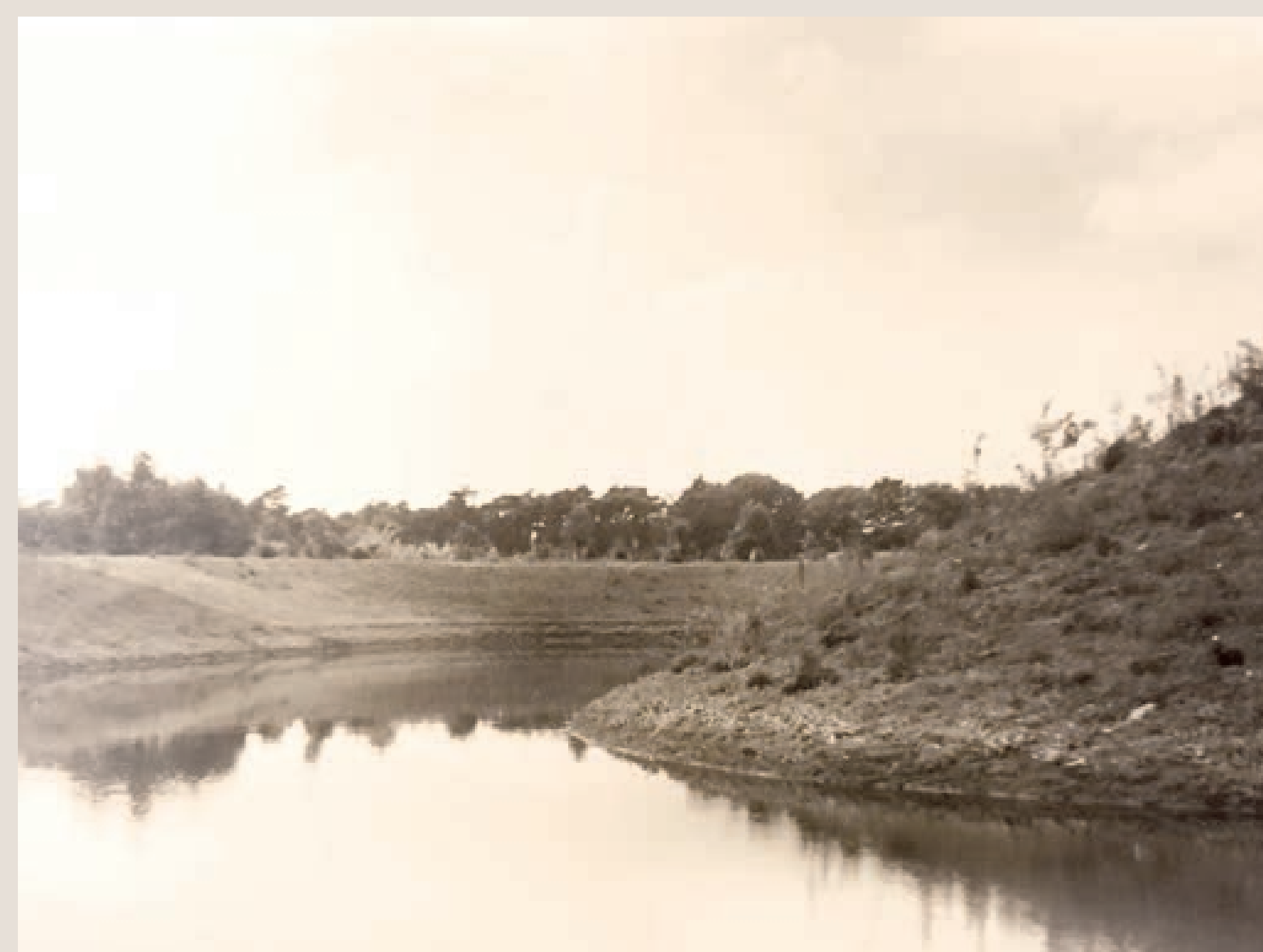
Vijver Thorbeckepark, kort na de aanleg

Het huidige Thorbeckepark is aan het begin van de 20e eeuw onderdeel van een groot bosgebied. Een deel daarvan hoort bij landgoed Vollenhoven, een ander deel bij het gloednieuwe Christelijk Sanatorium.