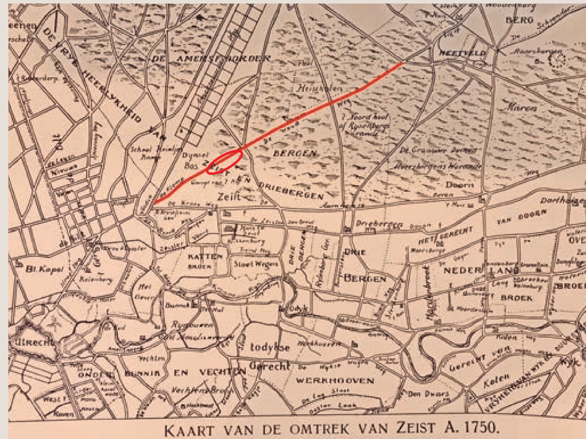
Kaart van de omtrek van Zeist, 1750. Ter hoogte van het huidige Thorbeckepark is de Oude Woudenbergse Zandweg goed herkenbaar