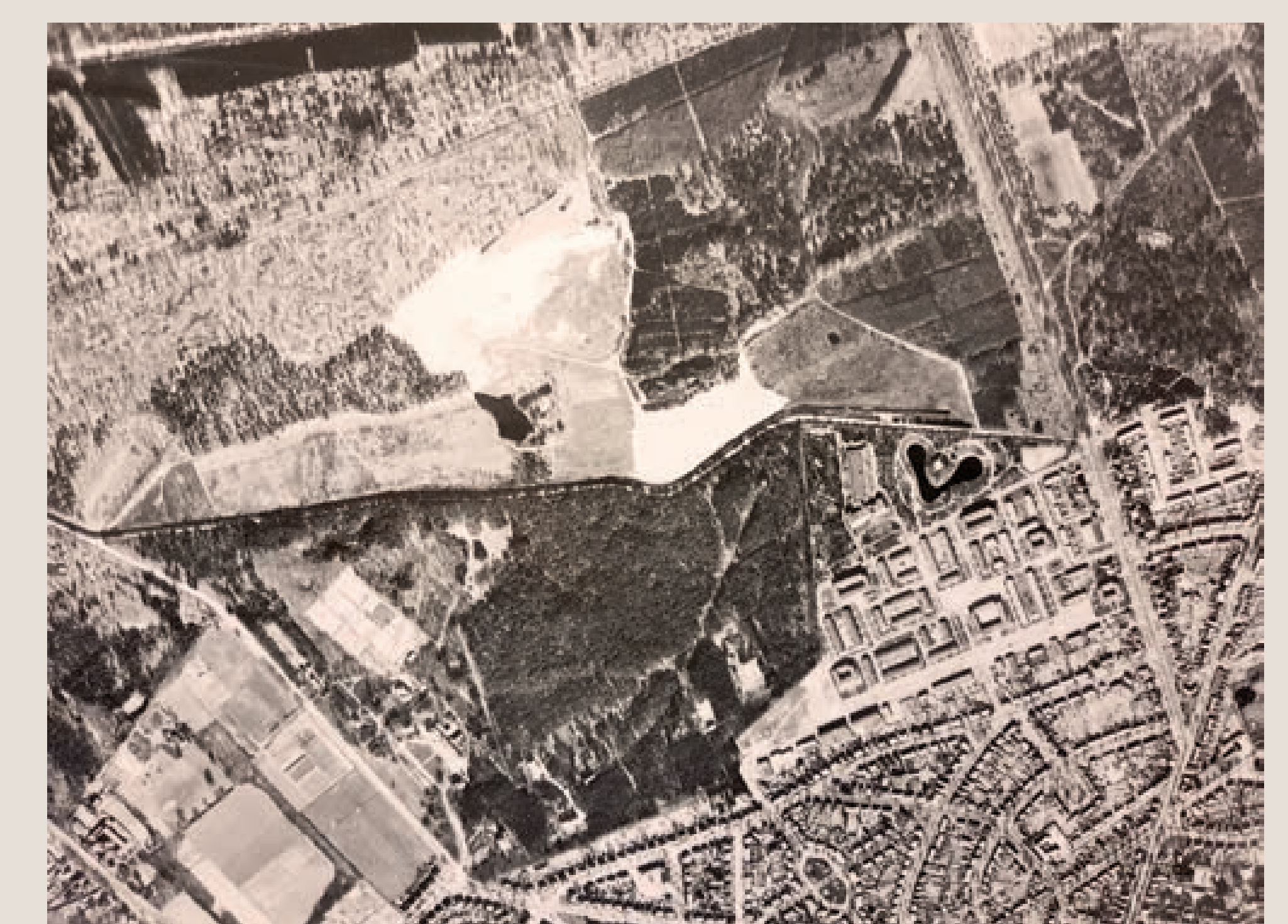
Luchtfoto Staatsliedenkwartier en omgeving, ca. 1956