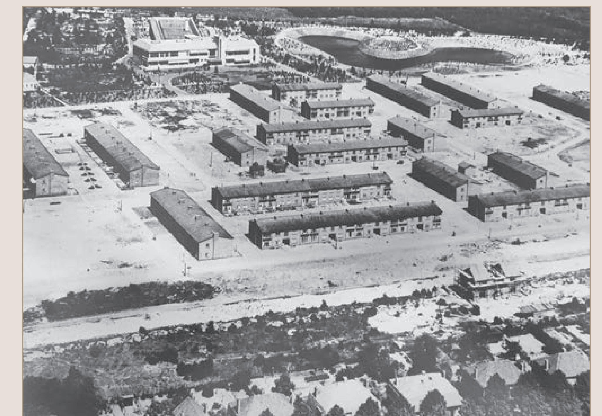
Aanleg van het Staatsliedenkwartier, ca. 1953. Bovenin de foto is de vijver van het Thorbeckepark herkenbaar.