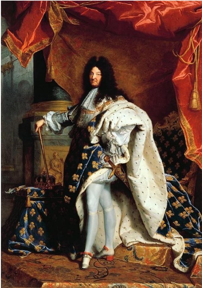
Afbeelding 1: Lodewijk XIV

De organisatie van de Rampjaaractiviteiten in Zeist levert soms prachtige nieuwe inzichten op. Zo zijn we gestuit op een gerucht over het bed waarin Lodewijk XIV (afbeelding 1) zou hebben geslapen tijdens zijn verblijf in Zeist.