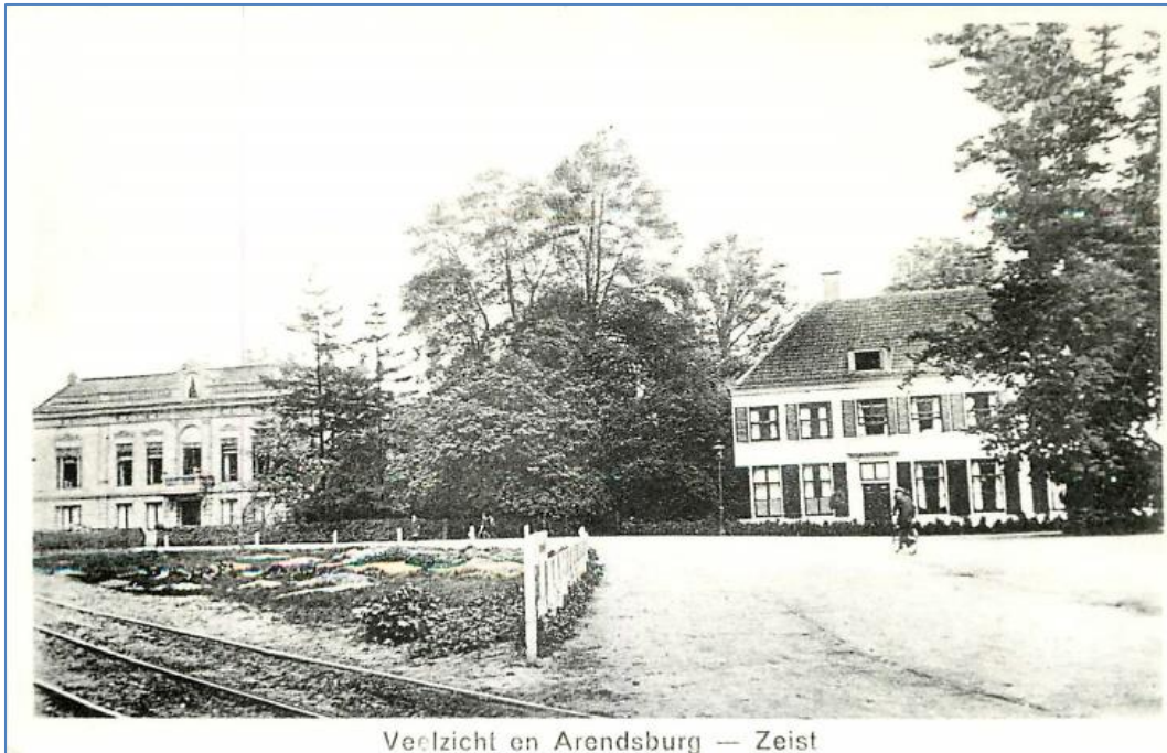
Verzicht en Arendsburg — Zeist

Afbeelding 2: villa Veelzicht op de plek van het huidige politiebureau. Veelzicht is het resultaat van een ingrijpende verbouwing van Bogaerdslust waarin Lodewijk XIV heeft geslapen