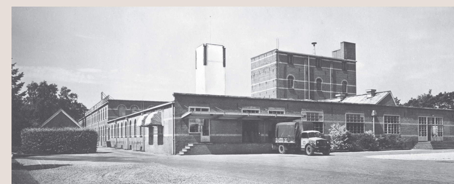
Een vrachtwagen bij het laadplatform van Strabo in 1960