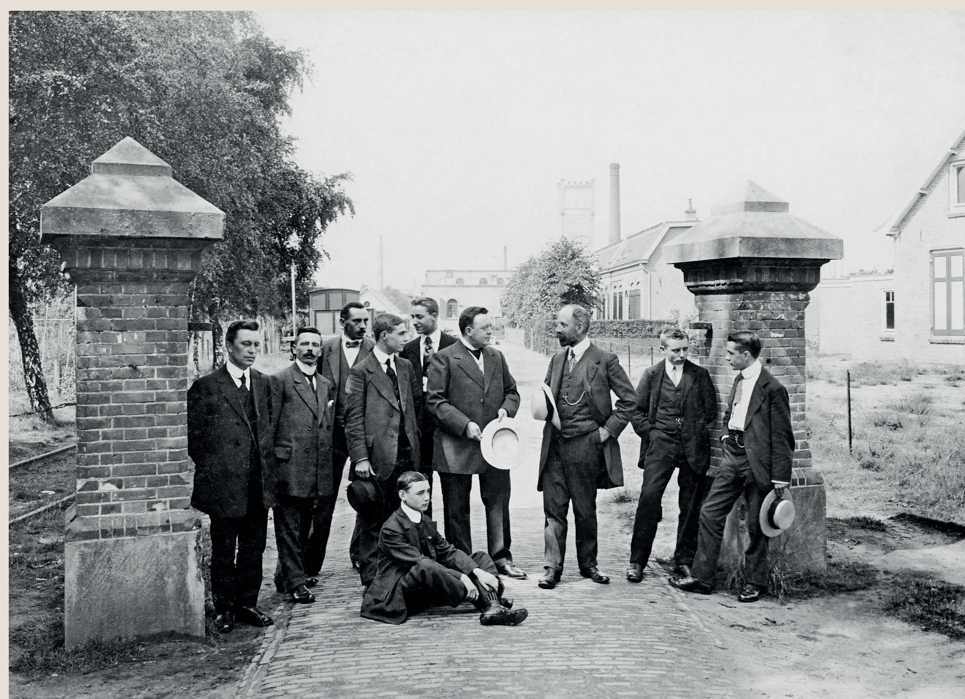
Leidinggevenden bij de ingang van het fabrieksterrein