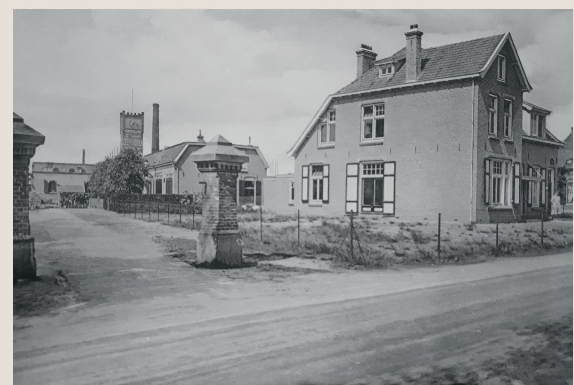
Ingang van de fabriek met rechts het nog bestaande pand met de woning voor de bedrijfsleider en het postkantoor