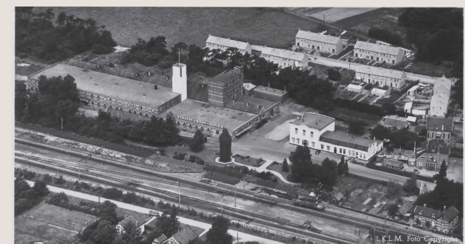
N.V. PAPIERINDUSTRIE VAN STRATEN & BOON DEN DOLDER - HOLLAND