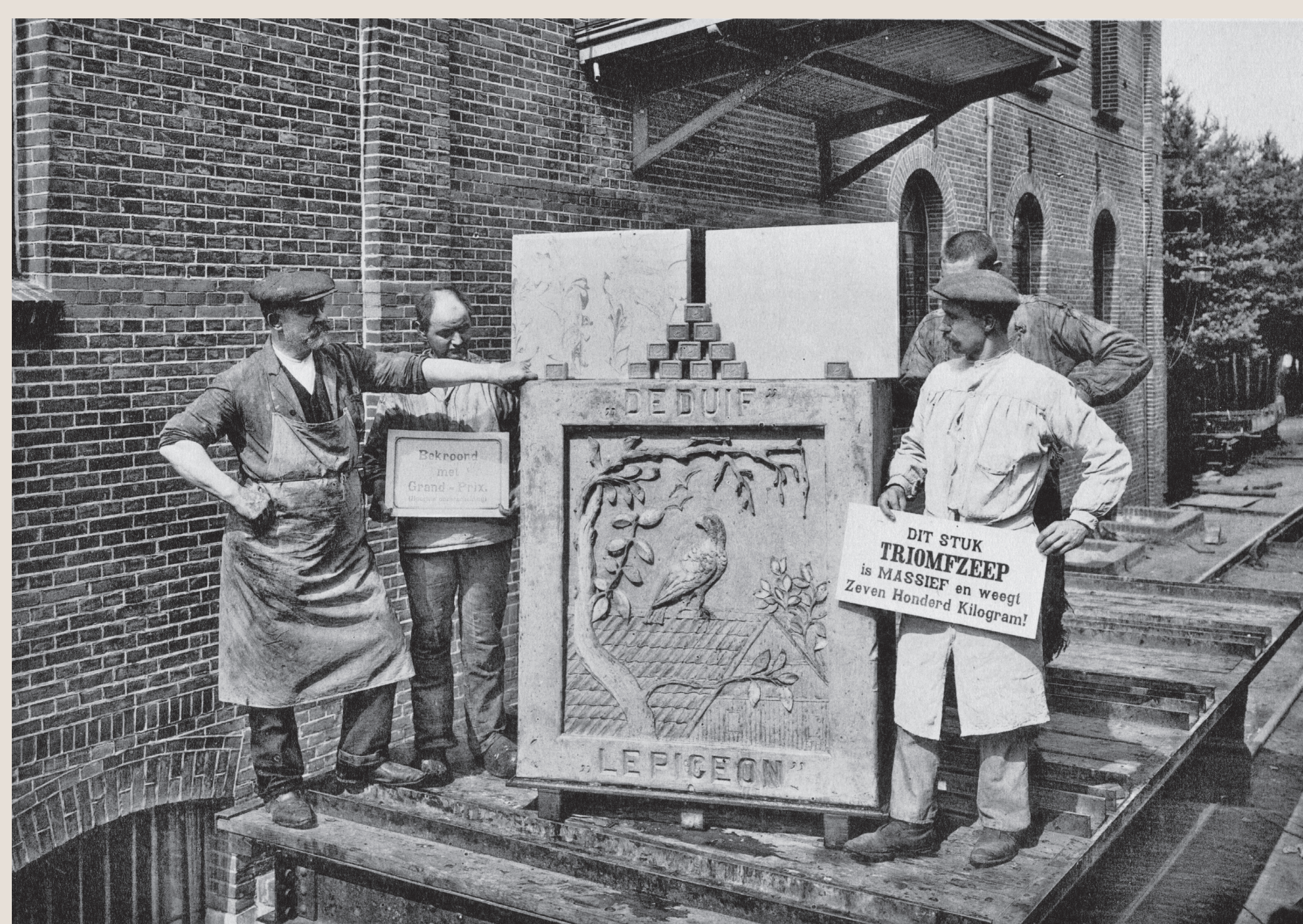
Medewerkers met een stuk Triomfzeep van 700 kilo, bedoeld voor exposities

Aan de overzijde van de straat bevindt zich de ingang van een historisch fabrieksterrein dat een aantal bedrijven uit de brand heeft geholpen.