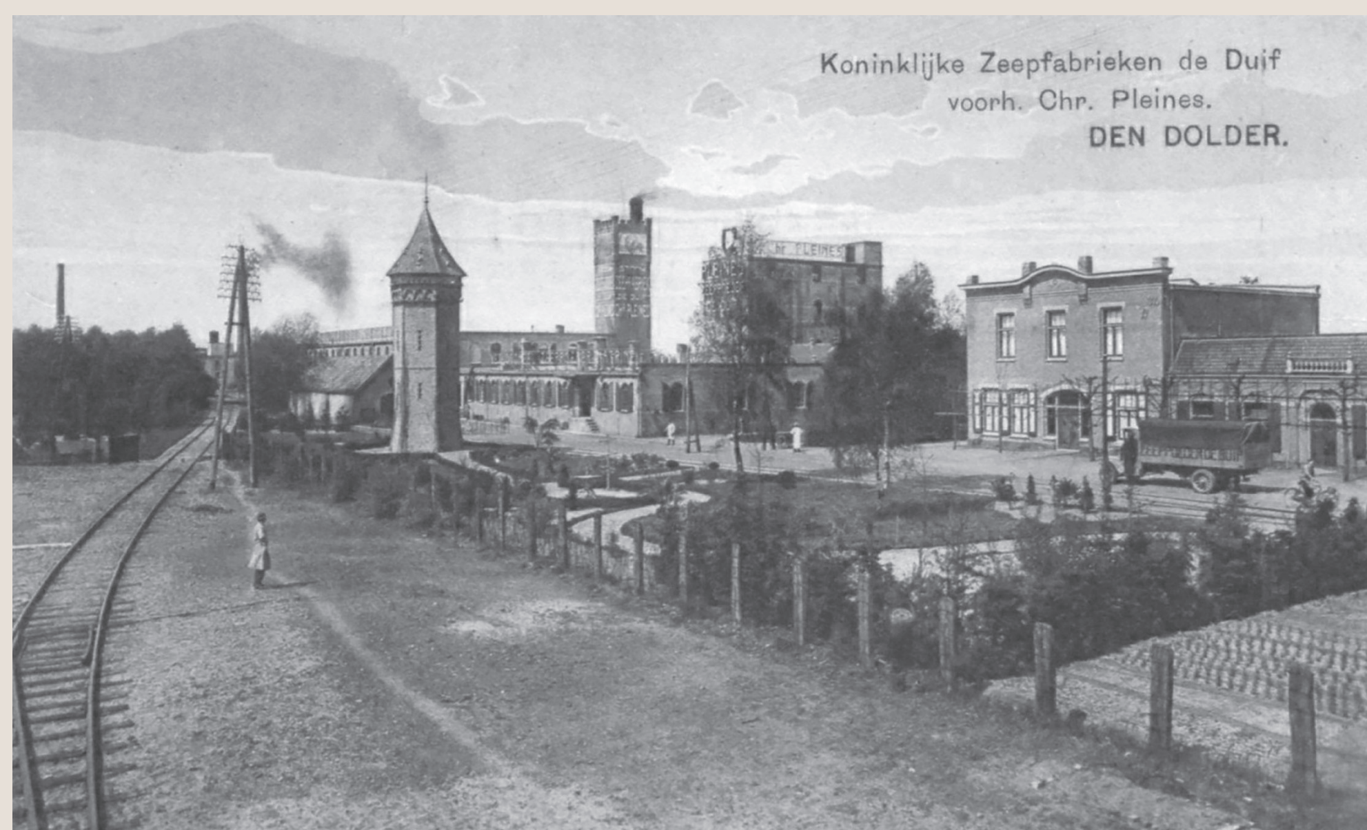
Zeepfabriek De Duif met aftakking van de spoorlijn