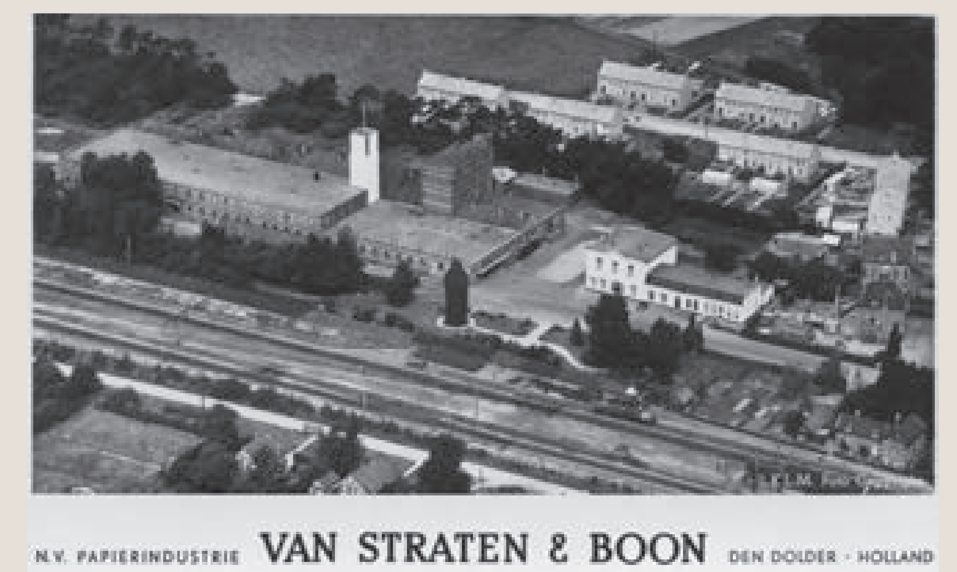
Het fabrieksterrein in de periode Strabo