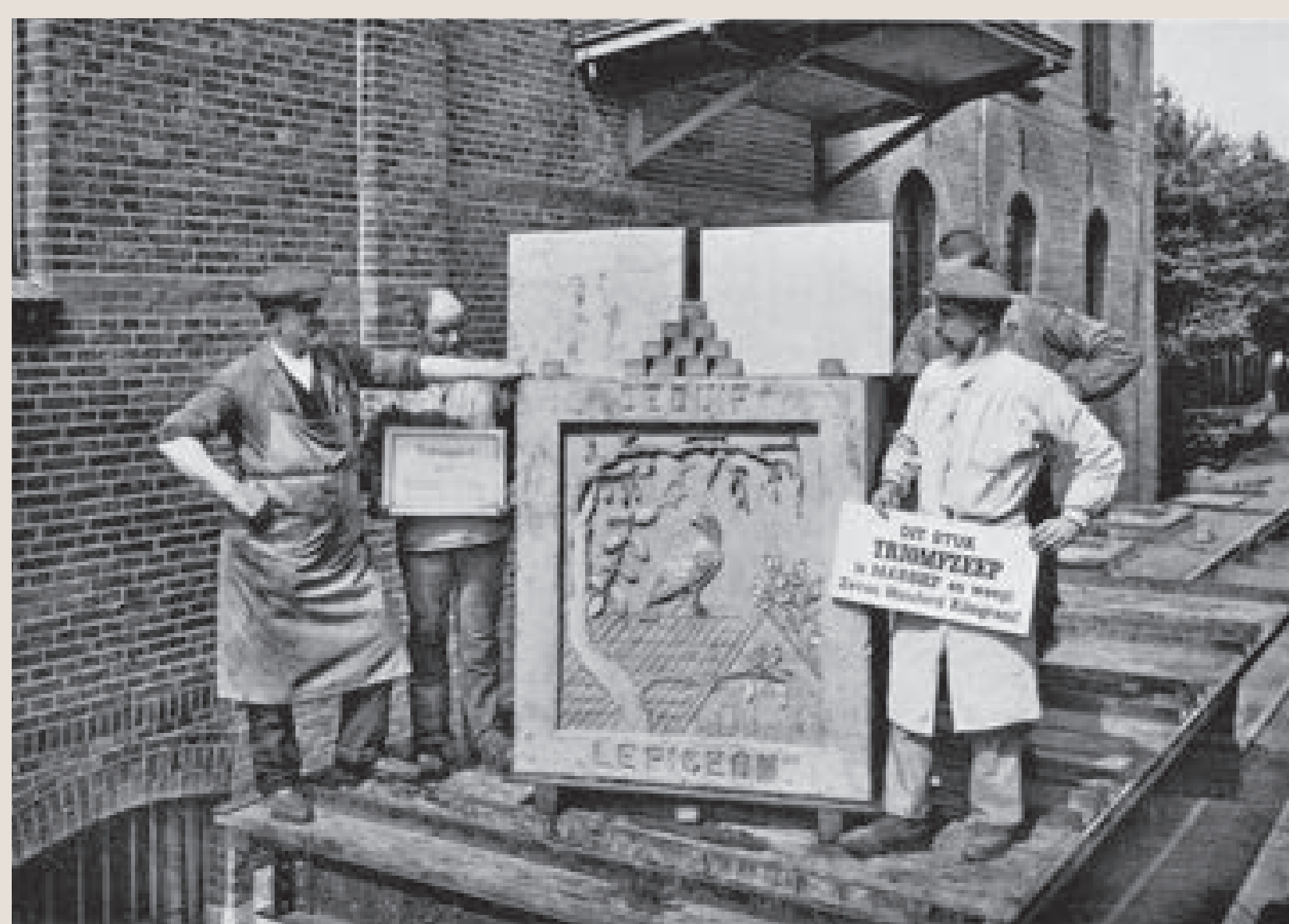
Medewerkers met een stuk Triomfzeep van 700 kilo, bedoeld voor exposities

U staat bij de historische fabrieksingang van veel uit de brand geholpen bedrijven.