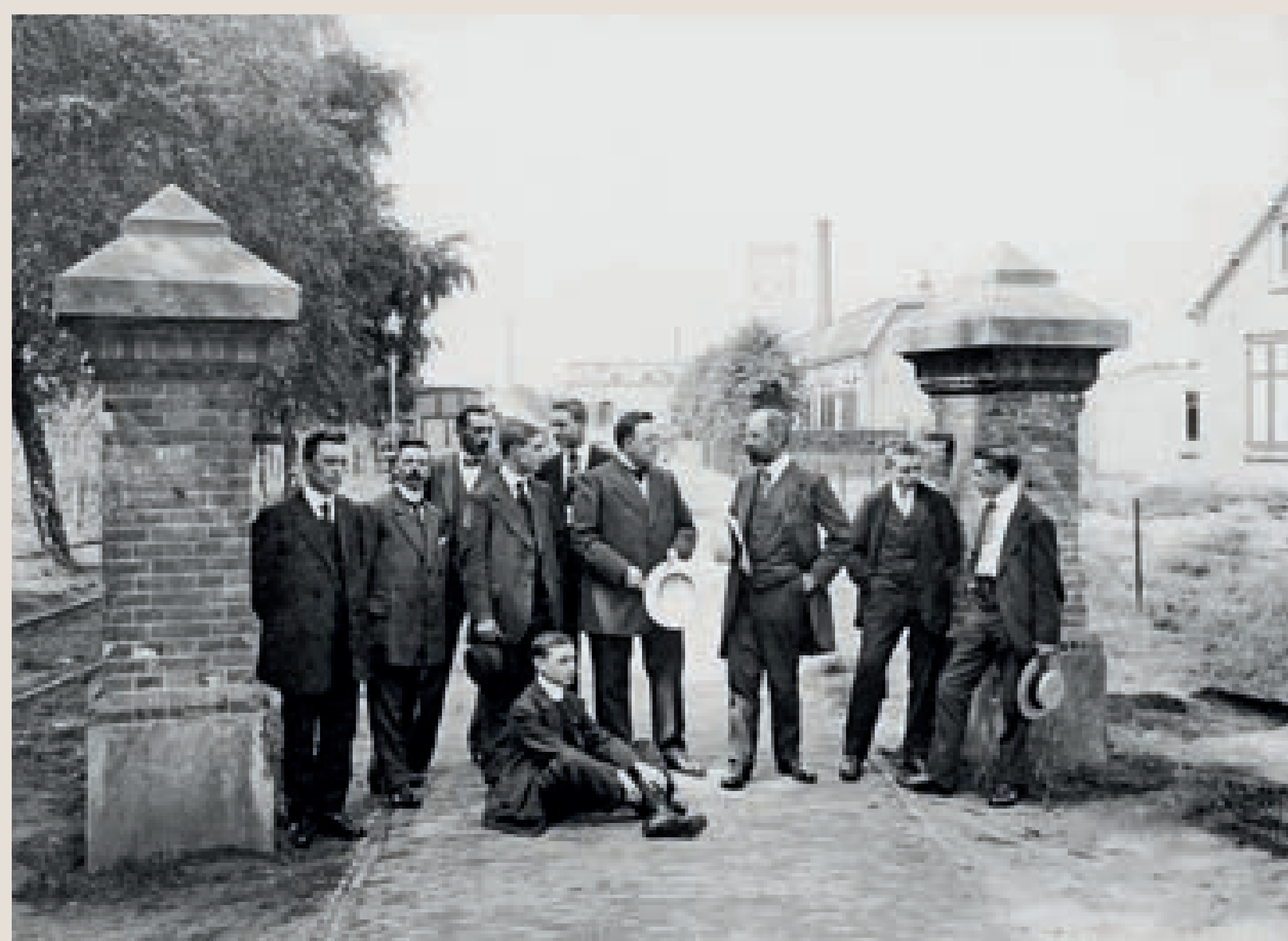
Leidinggevenden bij de ingang van het fabrieksterrein