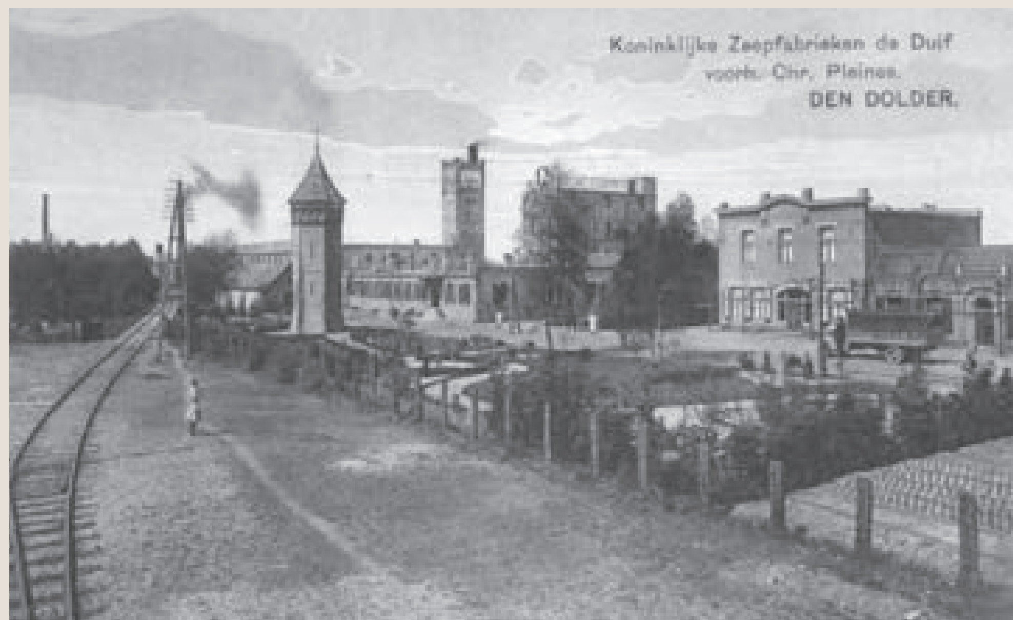
Zeepfabriek De Duif met aftakking van de spoorlijn