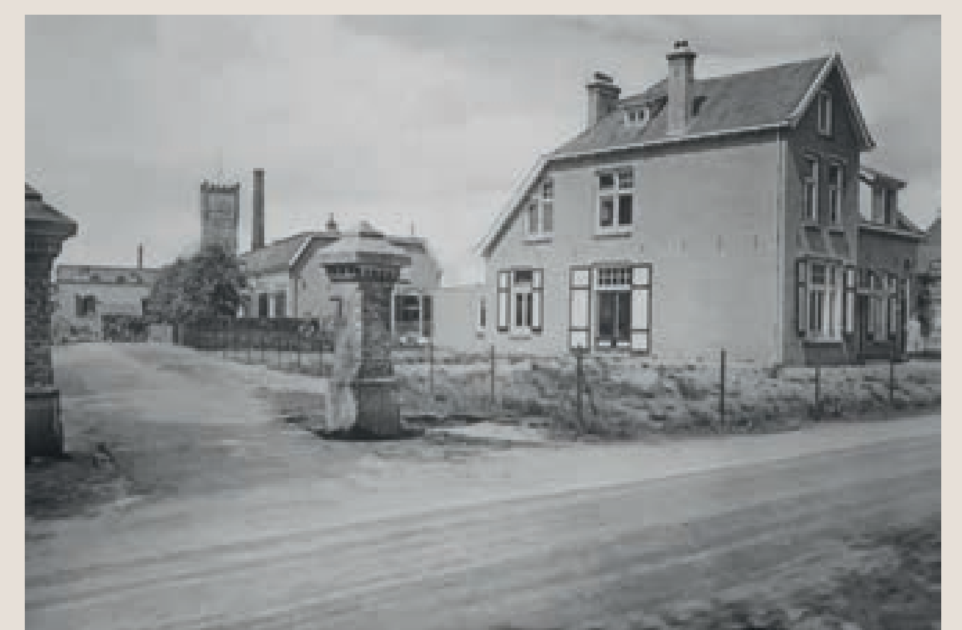
Ingang van de fabriek met rechts het nog bestaande pand met de woning voor de bedrijfsleider en het postkantoor