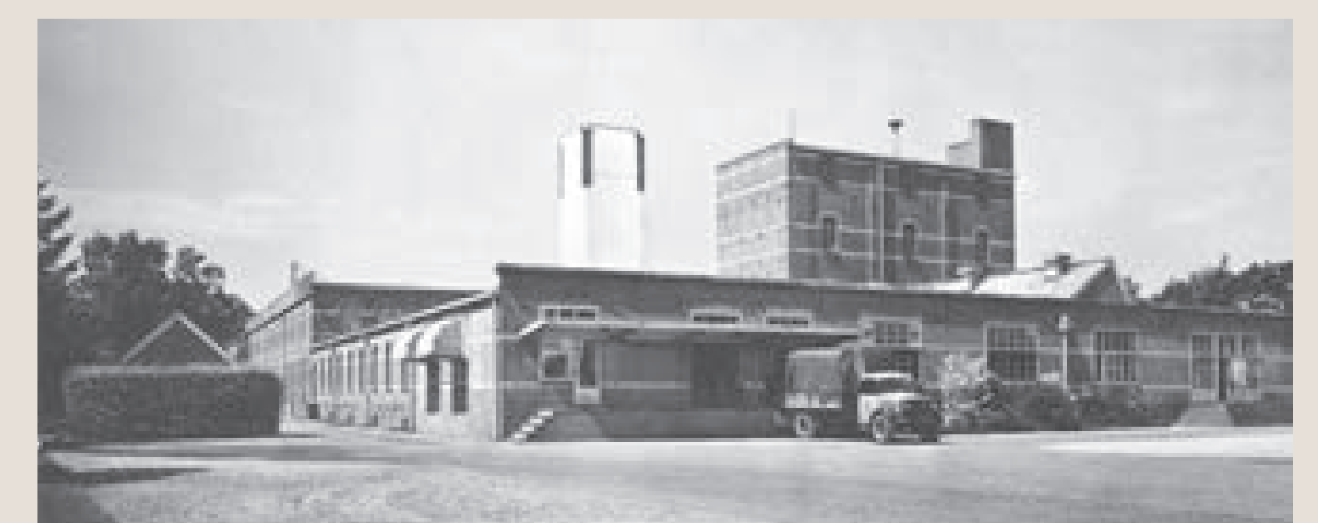
Een vrachtwagen bij het laadplatform van Strabo in 1960