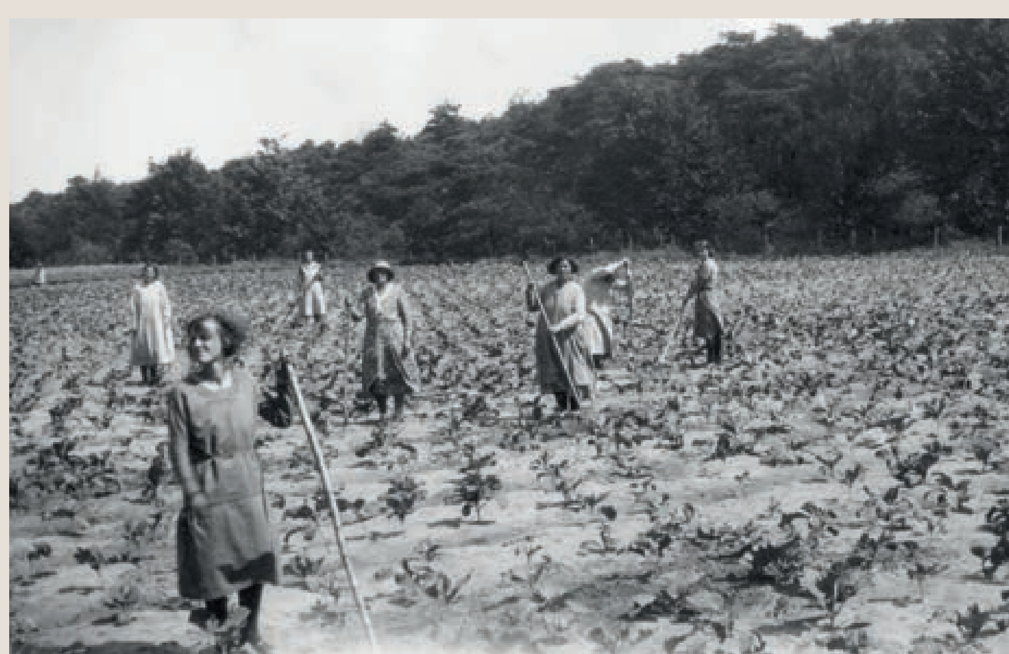
Vrouwelijke patiënten aan het werk op de vloeivelden