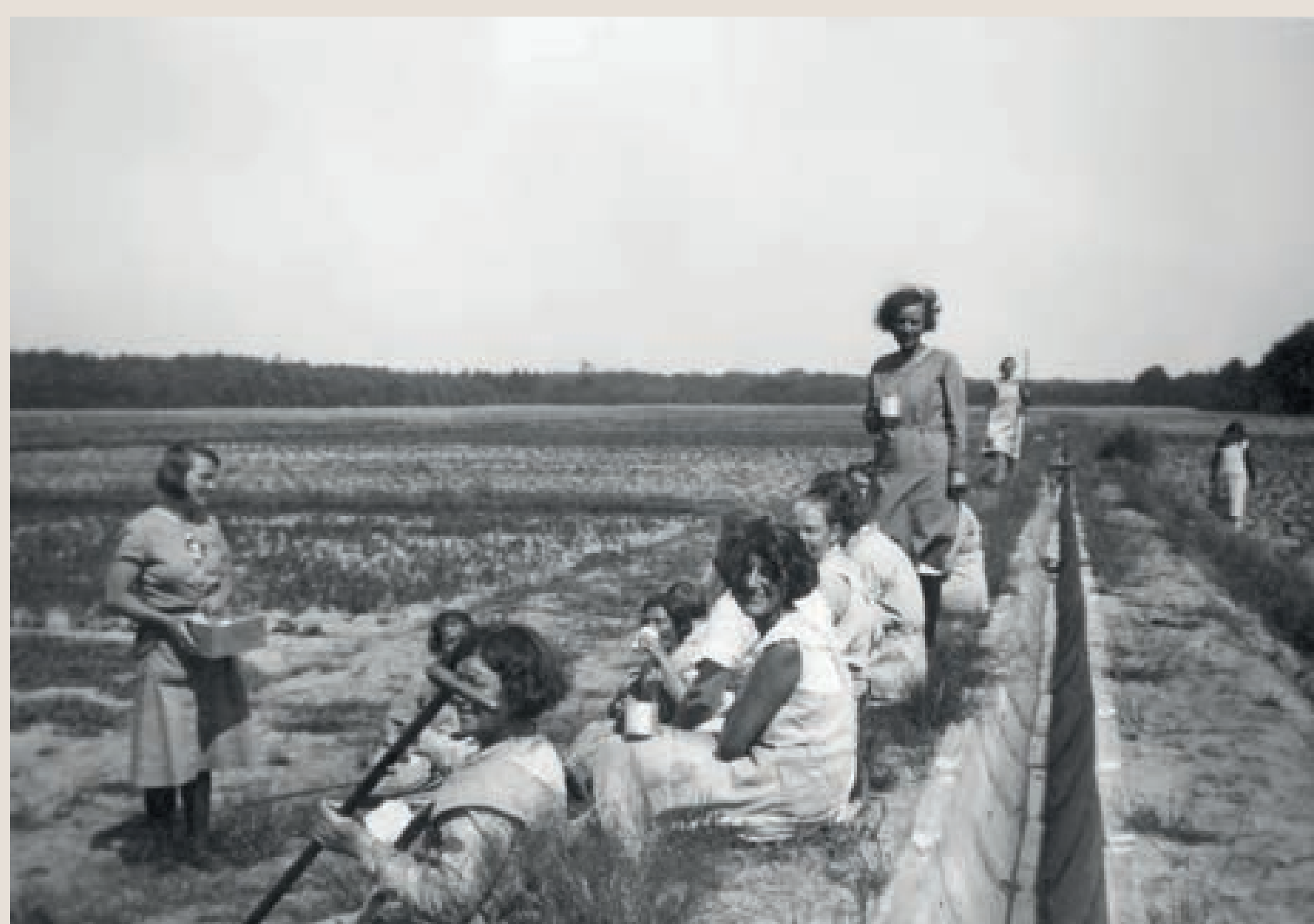
Een korte pauze bij een betonnen verdeelgoot op een dijkje