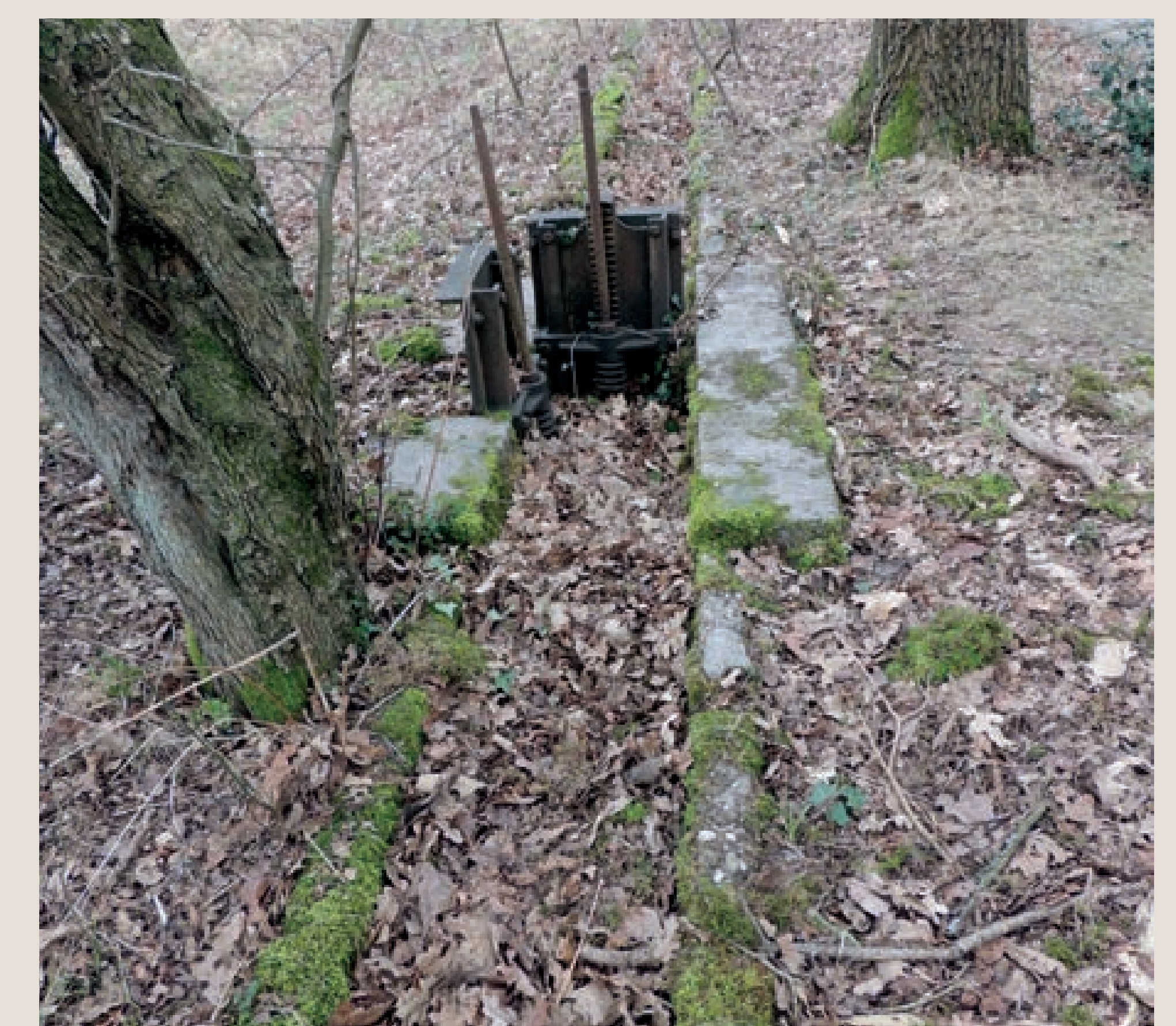
Een overgebleven afsluiter van het historische rioolnet, foto uit 2013 van Frits Stuurman (Bron: Historische Vereniging Den Dolder)