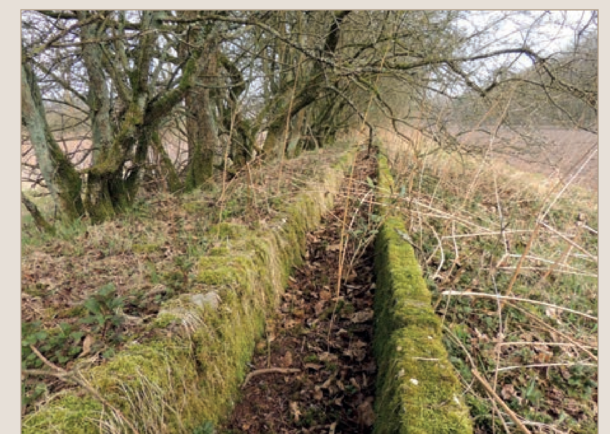
Het restant van een betongoot, foto uit 2013 van Frits Stuurman (Bron: Historische Vereniging Den Dolder)